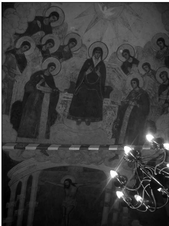
Рис. 8. Фреска алтарной конхи ц. Благовещения в Ярославле. 1709 г.

Подводя итог проведенному анализу литургического контекста главной алтарной композиции и обусловленного им идейного переосмысления традиционного изображения, можно выделить три основных момента, по-новому характеризующих образ «О Тебе радуется»: композиция являлась собирательным образом Литургии, указывала