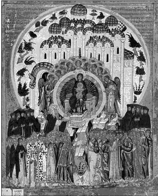
Рис. 1. «О Тебе радуется». Икона из собора Св. Софии в Новгороде. Конец XV — начало XVI вв. (НГОМЗ)

ля, первая половина XV в., из с. Ненокса на Белом море, ГЭ, конец XV в.) [3, с. 386]. Также довольно часто композиция встречается в эсхатологически насыщенных росписях папертей и нартексов храмов (западная галерея Благовещенского собора Московского Кремля, 1547–1551; притворы церквей XVII в.: Николы Мокрого в Ярославле, 1673; Воскресенского собора Романова-Борисоглебска, 1679–1680; Иоанна Предтечи в Толчкове, 1694–1695; притворы балканских храмов: главной церкви Бачковского монастыря, 1643; церкви Святого Афанасия в Арбанаси, 1667), что говорит о понимании образа Богородицы на престоле как апокалипсической «Жены, облаченной в солнце» (Откр. 12:1) [3, с. 384].