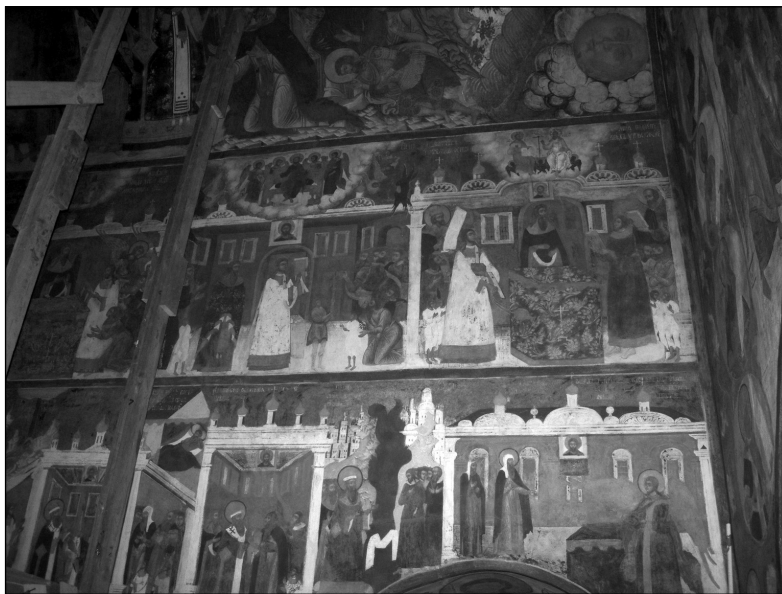
Рис. 3. «Откровение святителя Григория о Божественной Литургии» (фрагмент). Фреска ц. Иоанна Предтечи в Толчкове. Ярославль. 1694–1695 гг.

В большинстве ярославских храмов данного периода восточную стену центральной апсиды, непосредственно под фреской «О Тебе радуется», занимает многосюжетный иконографический цикл, иллюстрирующий популярное в XVII в. «Откровение святителя Григория о Божественной Литургии» (рис. 3). В рамках этого цикла в хронологической последовательности представлены основные моменты литургии, что можно видеть в росписях церкви Богоявления (1692), Иоанна Предтечи в Толчкове, Спаса на Городу (1693), Федоровского собора (1715), церковью Архангела Михаила (1731) и Иоанна Златоуста (1732–1733). Изображение песнопения «О Тебе радуется», доминирующее над сюжетами из Божественной службы, приобретает здесь особые символические черты: Богородица на фоне пятиглавого храма мыслится не столько как образ Церкви в общем смысле, что было принято в традиционных богословских толкованиях, сколько как своеобразная «икона», собирательный образ самой Литургии [4, с. 76].