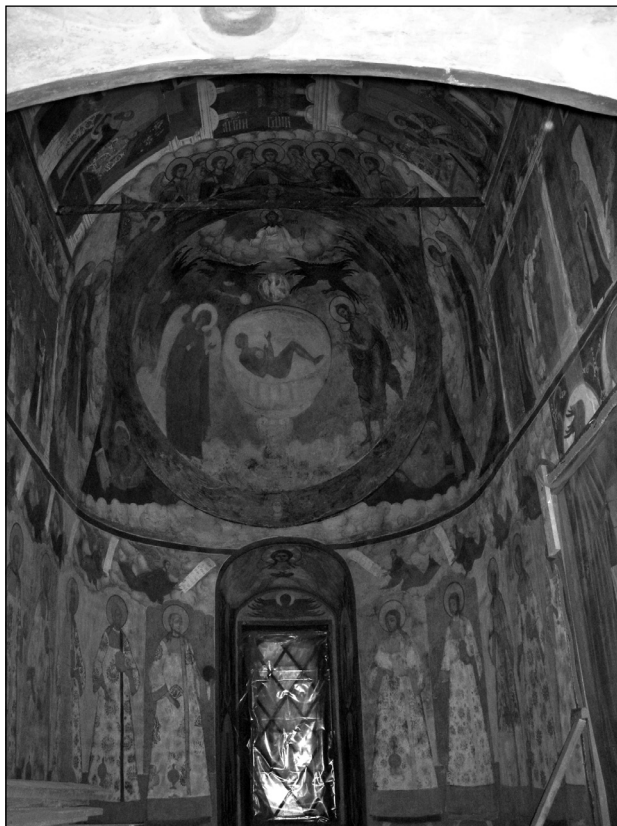
Рис. 6. «Се Агнец Божий». Фреска ц. Иоанна Предтечи в Толчкове. Ярославль. 1694–1695 гг.