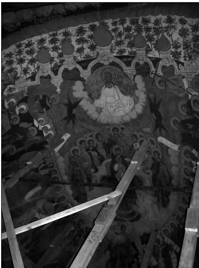
Рис. 2. «О Тебе радуется». Фреска ц. Иоанна Предтечи в Толчкове. Ярославль. 1694–1695 гг.

изображений для конх апсид, среди которых наиболее распространенными стали композиции «Похвала Богородице», «Великий Вход», надписанный словами Херувимской песни Великой Субботы: Да молчит всяка плоть человека , — и «Покров».