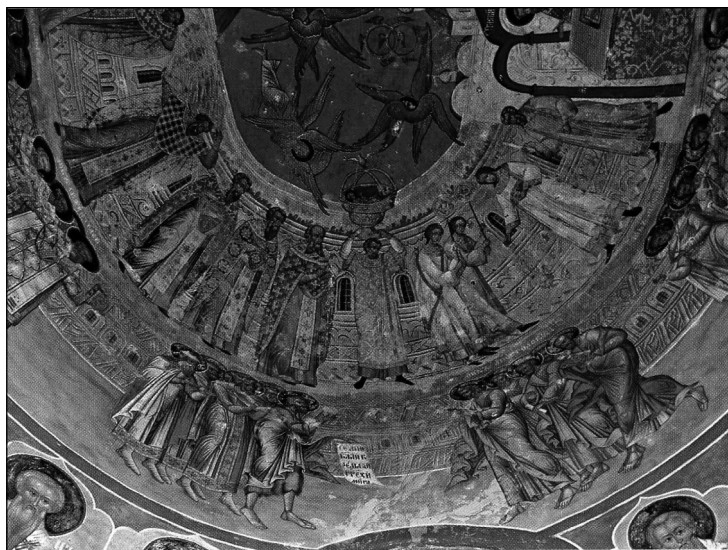
Рис. 4. «Великий Вход». Фреска ц. Николы Надеина в Ярославле. 1640 г. Под записью 1882 г.

Вторая важнейшая идея, лежащая в основе алтарной композиции «О Тебе радуется», — это скрытый жертвенный смысл изображения. Являясь образом Литургии, фреска «О Тебе радуется» одновременно представляет и ее важнейшее действие — таинство Евхаристии, бескровную жертву. Подтверждая эту мысль, можно отметить очевидные композиционные параллели сцены «О Тебе радуется» с располагавшимся в этой части апсиды образом «Великого Входа»: трехчастное построение изображения, мотив пятиглавого храма, на фоне которого разворачивается действие, и фигура Христа Эммануила, занимающая центральное положение в композиции (рис. 4).