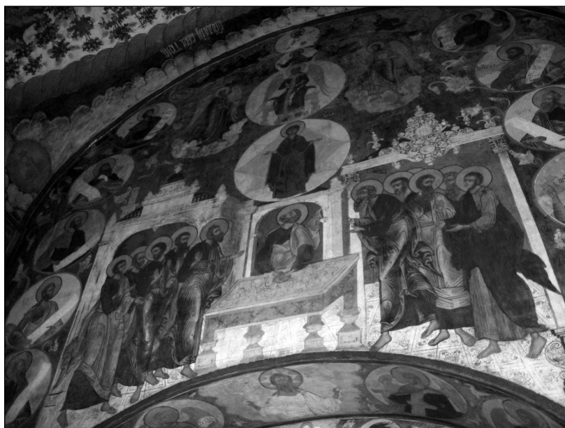
Рис. 7. «Видение Божией Матери апостолом Петром в преломлении хлеба». Фреска ц. Иоанна Предтечи в Толчкове. Ярославль. 1694–1695 гг.