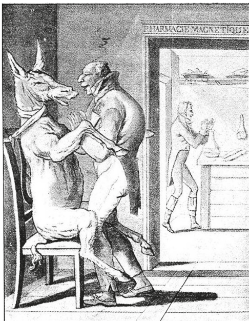
Рис. 6. Неизвестный автор. Наши факульте- ты связаны. Первая половина XIX в. Музей «Кол- лекция Велкома», Лондон. (Wellcome Library, ли- цензия Attribution 4.0 International /CC BY 4.0/). https://wellcomecollection.org/works/ra84gbcd // Credit: Caricature of mesmerism. Credit: Wellcome Collection. Attribution 4.0 International (CC BY 4.0)

состоянии в результате воздействия флюида врача, который научные иллюстраторы вербализуют, придавая ему образ струй воды (рис. 7). Почти всегда врач изображается с поднятыми горизонтально руками, направленными к обессиленной пациентке, продолжая развивать парадигму обессиленного и подчиненного женского тела, а также перевода месмерическую практику в форму гипноза, фиксируя иконографию и для репрезентации гипноза.