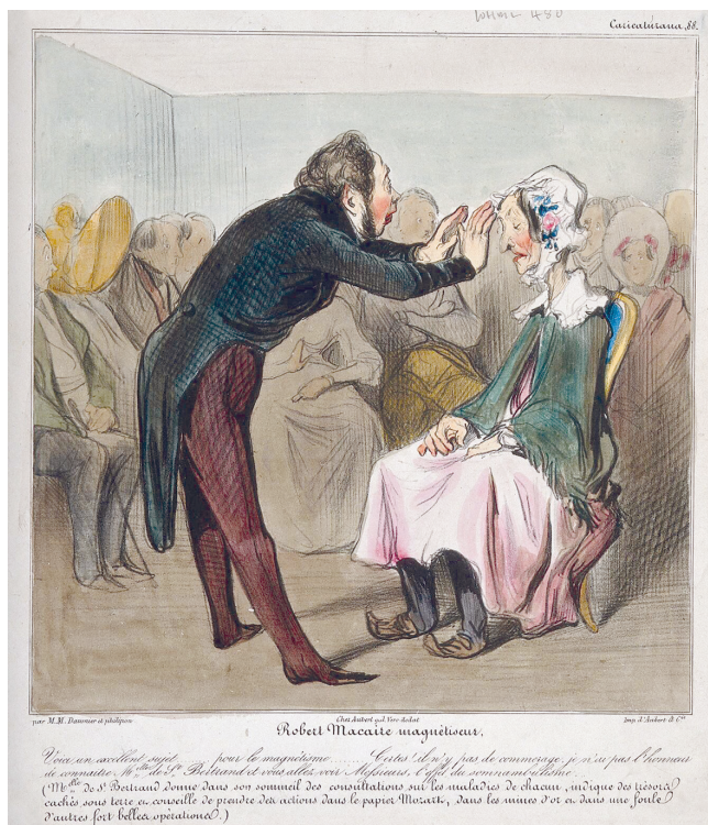
Рис. 8. Оноре Домье. Робер Макер — магнетизер. 1838. Литография. Музей «Коллекция Велкома», Лондон. (Wellcome Library no. 16475i, лицензия Attribution 4.0 International / CC BY 4.0/). https://wellcomecollection.org/works/rjf7j4w2 // Credit: Robert Macaire mesmerises an old lady in front of an audience. Coloured lithograph by H. Daumier. Credit: Wellcome Collection. Attribution 4.0 International (CC BY 4.0)

чистую случайность сеанса вследствие повышенной восприимчивости «пациентки», но и на несостоятельность этой практики. Его литография также является образцом новой иконографии сомнамбулизма и спиритизма в искусстве, возникшей под влиянием иконографии месмерического сеанса.