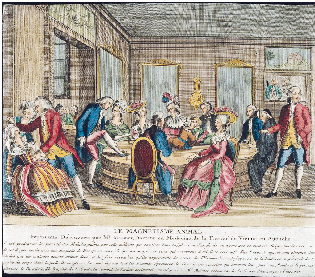
Рис. 2. Неизвестный автор. Ванна Месмера (Пациенты в Париже, проходящие лечение животным магнетизмом Месмера). Ок. 1777–1784 гг. Гравюра по оригинальному рисунку Клод-Луи Дерэ 1777–1784 гг. Музей «Коллекция Велкома», Лондон. (Wellcome Library no. 17918i, лицензия Attribution 4.0 International /CC BY 4.0/). https://wellcomecollection.org/works/fthv79zp // Credit: Patients in Paris receiving Mesmeres animal magnetism therapy. Coloured etching after C-L. Desrais. Credit: Wellcome Collection. Attribution 4.0 International (CC BY 4.0)

внутри чана. Необходимо отметить, что в этом рисунке Дерэ изображает «чан» для одного пациента, а в следующем — «ванну» для группового сеанса. «Ванна Месмера» (иначе «бакэ» — от французского слова baquet — «чан») — деревянный или чугунный чан, заполненный намагниченной водой и закрытый крышкой с проделанными отверстиями, сквозь них проходят веревки или железные стержни (чаще всего Г-образной формы), за которые должны были держаться пациенты. Собираясь на групповой сеанс, они рассаживались вокруг ванны, а магнетизер (или месмерист), т. е. практикующий теории Месмера так называемый «врач», передавал свой усиленный флюид посредством магнетических пассивов (удерживания рук над передатчиком энергии — водой). Помимо этого, в «тяжелых» случаях практиковались и индивидуальные сеансы, во время которых месмерист мог непосредственно дотрагиваться до пациента или использовать специальный металлический жезл-проводник его