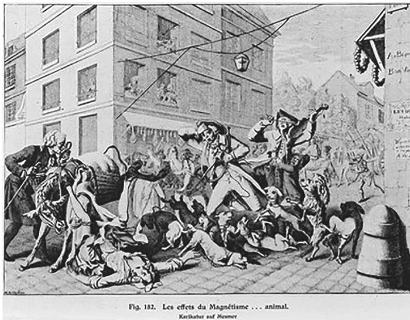
Рис. 4. Эжен Голландский. Эффект от месмеризма (Die Karikatur und Satire in der Medizin: mediko-kunsthistorisches Studie / von Eugen Holländer). 1921 (копия оригинальной гравюры 1784 г.). Гравюра. Музей «Коллекция Велкома», Лондон. (Wellcome Library, лицензия Attribution 4.0 International /CC BY 4.0/). https://wellcomecollection.org/works/hn7aak3j/images?id=hzgaq4c3 // Credit: Die Karikatur und Satire in der Medizin: mediko-kunsthistorisches Studie / von Eugen Holländer. Credit: Wellcome Collection. Attribution 4.0 International (CC BY 4.0)

Несмотря на то что в конце XVIII в. месмеризм признали шарлатанской практикой, в первое десятилетие XIX в. животный магнетизм вновь оживает в связи с увлечением паранормальными явлениями, сверхъестественным и потусторонним. Это было следствием развития романтизма, а также прогресса в медицине и становления ее как нового социального института, сдерживающего и ограничивающего человеческое тело. Конечно, месмеризм во многом способствовал введению врача в категорию «постороннего», однако развивавшиеся в обществе мистицизм, болезненные рефлексии о сущности и судьбе человека и антитеза живого и мертвого формировали новое отношение к человеку, пытались отыскать нечто, что не поддавалось разложению или препарации, — душу.