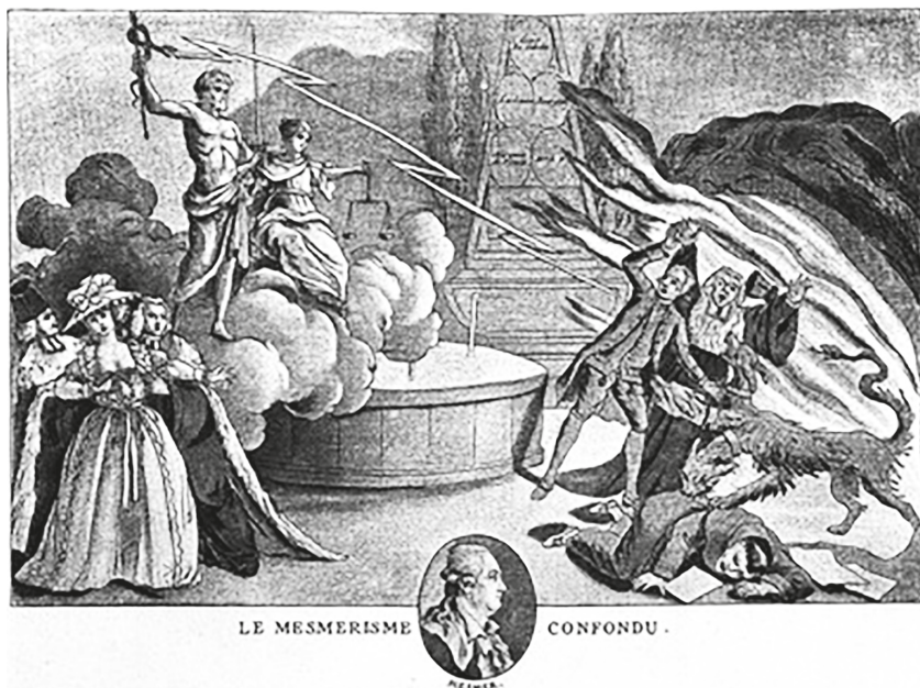
Fig. 184. Karikatur auf Mesmer.

Рис. 3. Эжен Голландский. Разоблачение месмеризма (Die Karikatur und Satire in der Medizin: mediko-kunsthistorisches Studie / von Eugen Holländer). 1921 (копия оригинальной гравюры второй половины XVIII в.). Гравюра. Музей «Коллекция Велкома», Лондон. (Wellcome Library, лицензия Attribution 4.0 International / CC BY 4.0/). https://wellcomecollection.org/works/hn7aak3j/images?id=d25s9hqs // Credit: Die Karikatur und Satire in der Medizin: mediko-kunsthistorisches Studie / von Eugen Holländer. Credit: Wellcome Collection. Attribution 4.0 International (CC BY 4.0)