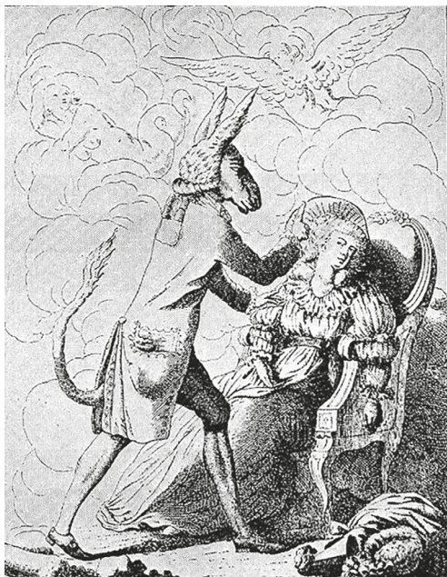
Рис. 5. Неизвестный автор. Волшебный па- лец, или Животный магнетизм. 1784. Гравюра. Музей «Коллекция Велкома», Лондон.