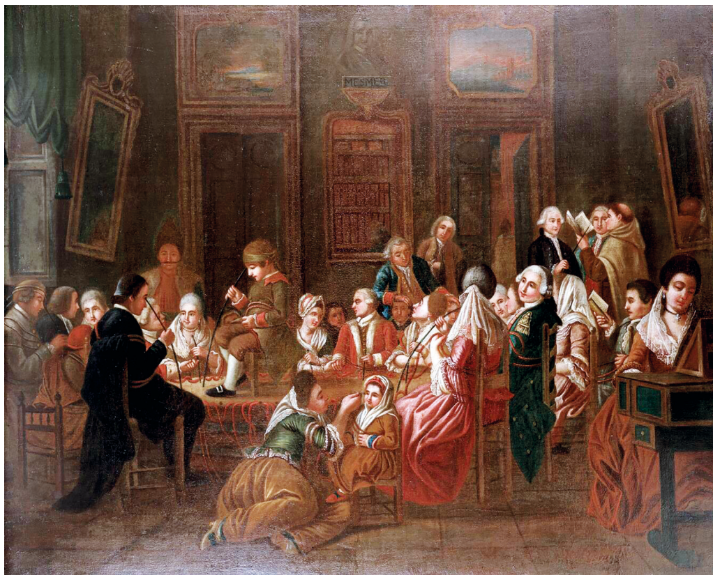
Рис. 1. Клод-Луи Дерэ. Месмерическая терапия. Ок. 1777–1784 гг. Холст, масло. Музей «Коллекция Велкома», Лондон. (Wellcome Library no. 44754i, лицензия Attribution 4.0 International / CC BY 4.0/). https://wellcomecollection.org/works/jgwhwyz4 // Credit: Mesmeric therapy. Oil painting by a French (?) painter, 1778/1784. Credit: Wellcome Collection. Attribution 4.0 International (CC BY 4.0)

значимость манипуляций врачей, то в этой работе ничто не указывает на то, что перед зрителем медицинский прием: сцена располагается в типичном для этого периода приемном зале, в правом углу картины художник изображает девушку, играющую на пианино, сзади нее несколько мужчин, среди которых священник, читающий вслух какую-то книгу, в центре группа людей сидит на странной конструкции или рядом с ней, а слева ряд пар ведет беседы.