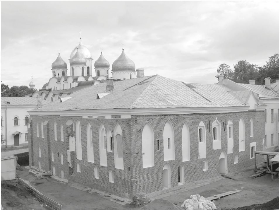
Рис. 1. Новгородская Владычная палата 1433 г. Вид с северо-запада.

Комплекс каменных построек на новгородском Владычном дворе, сложившийся в XIII — середине XV в., — уникальное явление в истории древнерусской архитектуры. Ни в одном городе Древней Руси не существовало столь сложного по структуре ансамбля каменных зданий, включавшего в себя как церковные сооружения, так и гражданские постройки различного назначения. Изучение построек новгородского Владычного двора оказывается актуальной задачей для понимания основных процессов, характерных для развития всей новгородской архитектуры XIII–XV вв.