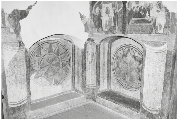
Рис. 5. Ниши в новгородской архитектуре 1430–1460-х годов: а — ниша сеней Владычной палаты 1433 г.; б — ниши церкви св. Сергия Радонежского 1459 г.

Возведение главной постройки дворца новгородского владыки — палаты 1433 г. — оказало определенное воздействие на дальнейшее развитие новгородской архитектуры: в 1440–1460-е годы в памятниках архитектуры Новгорода появляются новые конструктивные и декоративные черты, так или иначе связанные с архитектурой Владычной палаты новгородского Кремля. Однако далеко не все яркие особенности этого здания получают отражение в новгородских постройках середины — второй половины XV в., скорее можно говорить об особом значении архитектуры палаты 1433 г. именно для построек на Владычном дворе.