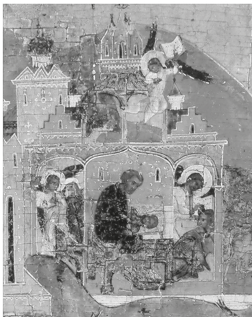
Рис. 3. Икона «Видение пономаря Тарасия». Новгородский государственный объединенный музей-заповедник. Последняя четверть XVI в. Фрагменты: а — постройка со ступенчатыми фронтонами на территории Владычного двора (палата 1433 г.); б — постройки со ступенчатыми фронтонами в Гончарском (Людином) конце.

печатной графике [12]. Очевидно, здесь мы также сталкиваемся с подобного рода явлением и представленная постройка — элемент архитектурного фона, а не изображение реального здания Владычной палаты. Таким образом, вероятно, строители Сергиевской церкви, входившей в единый комплекс с палатой 1433 г., ориентировались именно на фронтоны этого здания.