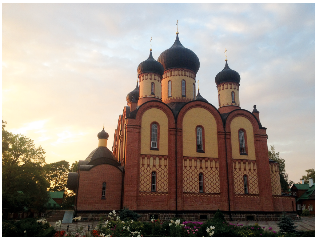
Рис. 5. Успенский собор Пюхтицкого монастыря. Южный фасад. Фото автора, 2018 г.