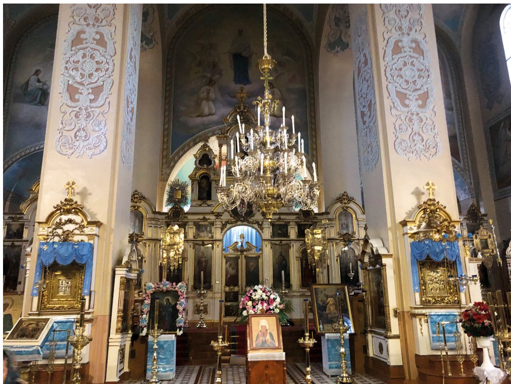
Рис. 6. Успенский собор Пюхтицкого монастыря. Интерьер.