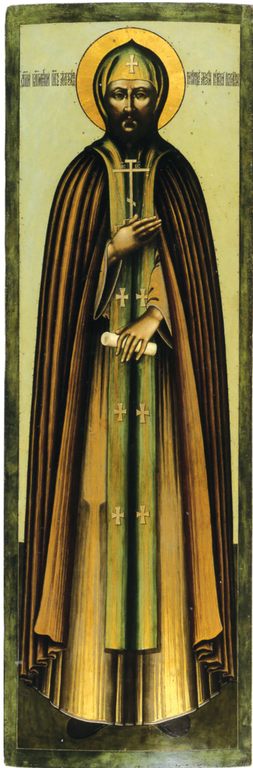
Рис. 5. Икона-крышка раки святого князя Александра Невского. 1694/1695. Москва. Оружейная палата. ГЭ

Колоколообразному силуэту и грузным пропорциям фигуры Александра, отличающим этот покров, более соответствуют широкие каймы зеленого атласа, покрытые литургическими надписями. Вязь шитых на верхней и нижней каймах букв непомерно удлинена. Надпись на фоне именует изображенного: ПРП(д)БНЬИ КНЗЬ АЛЕΞАНДРЪ НЕВСКИИ 16 .