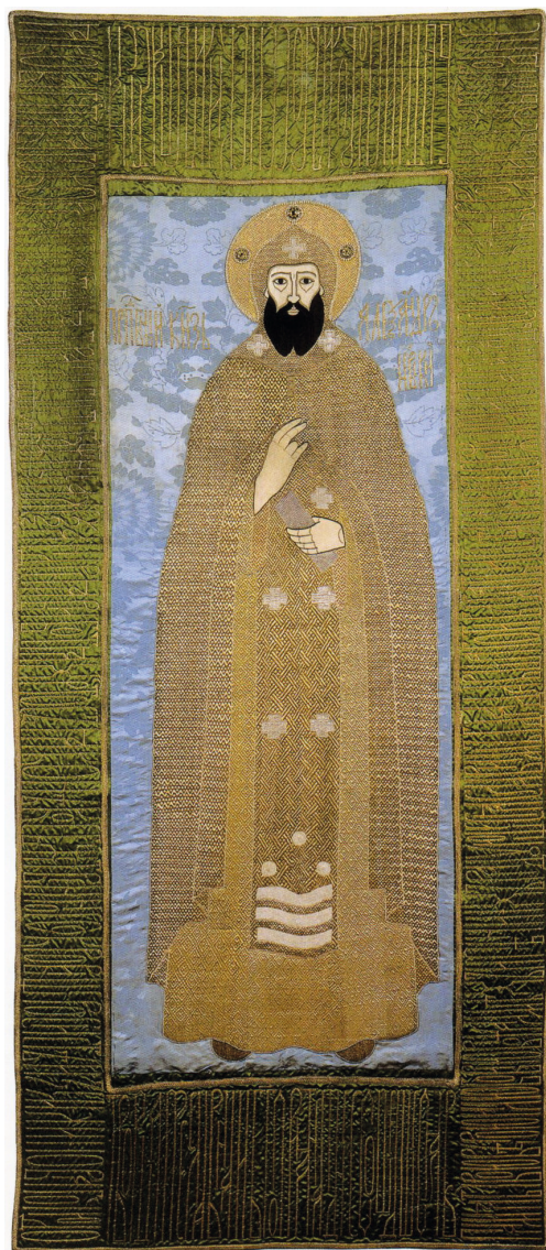
Рис. 3. Надгробный покров святого князя Александра Невского. Около 1697 г. Москва. Мастерская А. П. Бутурлиной. ГРМ