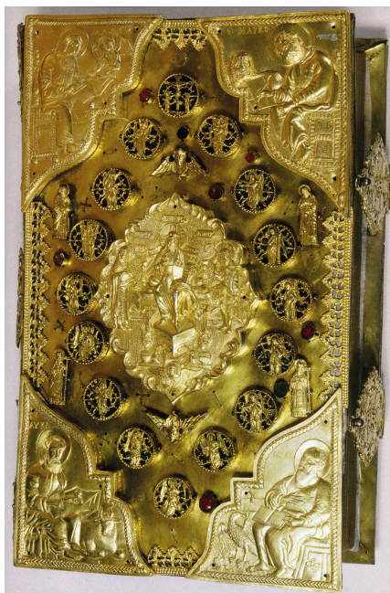
Рис. 6. Напрестольное Евангелие. Печать: Москва, 1681. Оклад: 1686. ГРМ

без труда отождествляется с Евангелием из ГРМ по изображению Успения Богородицы на нижней крышке: «Евангелие, моск[овской] п[ечати] 1684 г. 26 в чеканном сер[ебряном] окладе, с чеканным изображениям Успения Богоматери на нижней дске» [24, с. 164] 27 .