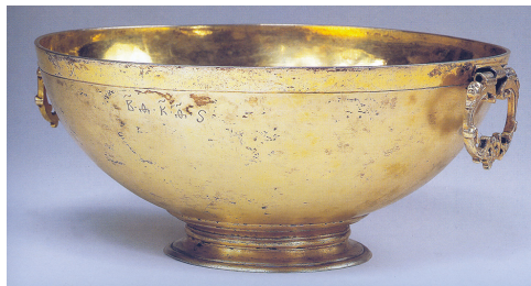
Рис. 2. Чаша патриарха Никона. Между 1652–1660 гг. ГРМ

Наиболее ранним по времени поступления в ризницу богослужебным предметом была чаша для ношения освященной воды, происходящая из Валдайского Иверского монастыря и, судя по владельческой надписи, принадлежавшая патриарху Никону (между 1652–1660) (рис. 2) 10 . Она упомянута в первых описях ризницы, датированных 1724–1725 гг., вместе с чаркой, также помеченной именем патриарха [1, с. 224]. «Чаша серебряная с поддоном, в середине золочена с колцами, в которой чаше держат святую воду, на ней подписано “Святейший Никон патриарх”, по подписи, весу дватцать девять золотников» 11 .