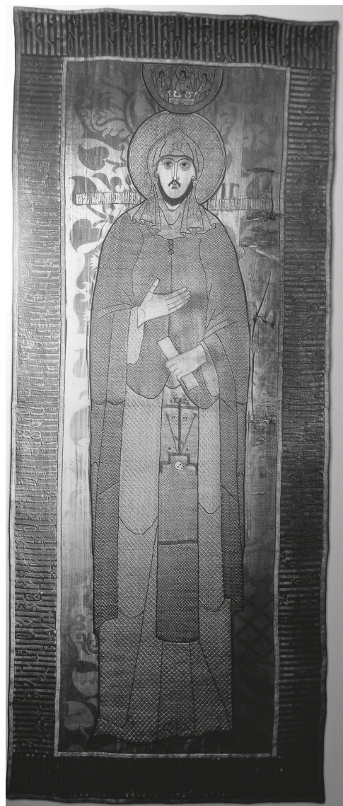
Рис. 4. Надгробный покров святого князя Александра Невского. Между 1642–1652 гг. Москва. Фото 1910 г.

князь также показан в монашеском облачении, но его лик не юн, а наделен чертами зрелого мужа. Изменилась форма бороды, прежде короткой, ровно подстриженной, а ныне окладистой, раздвоенной на конце. За счет рисунка и приемов шитья лик приобрел страдальческое выражение, не соответствующее прежним представлениям об идеальном бесстрастном образе святого.