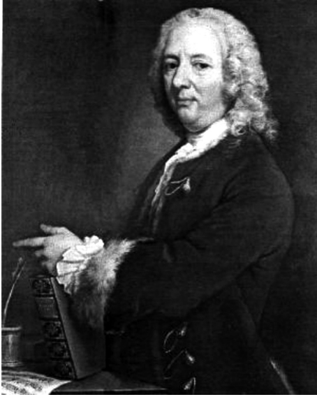
Рис. 3. Франческо Джеминиани (1687–1762)

Gratoso — медленно и приятно. Grave — медленный темп. Largo — очень медленно. Larghetto — не так медленно, как largo. Lento или Lentement — медленно. Presto — быстро или скоро. Prestissimo — очень быстро. Vivace — оживленно и воодушевленно.