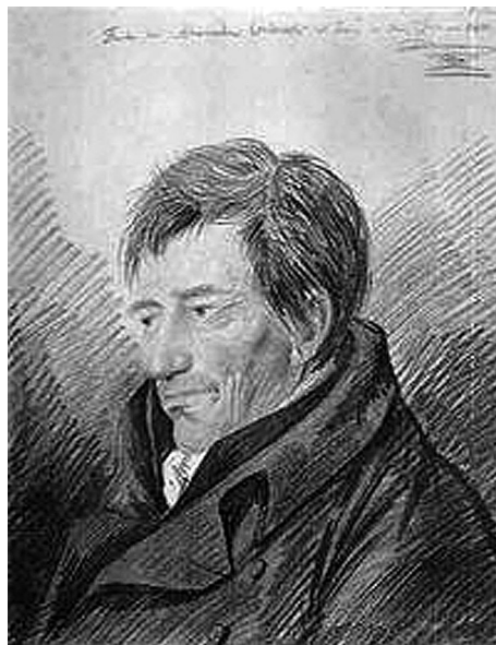
Рис. 4. Муцио Клементи (1752–1832)

Adagio , очень медленно, самый медленный темп. Largo , медленный темп. Larghetto , медленно, но не столь медленно, как largo . Andante , умеренный темп (medium time). Andantino , немного быстрее, чем andante . Allegretto , в большей степени быстро, однако не так быстро, как allegro . Allegro , быстрый темп. Presto , очень быстро. Prestissimo , быстро, насколько это возможно.