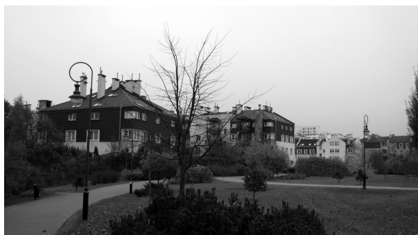
Рис. 3. Урсыновский пассаж