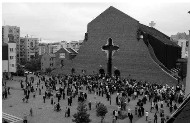
Рис. 2. Костел в Северном Урсынове