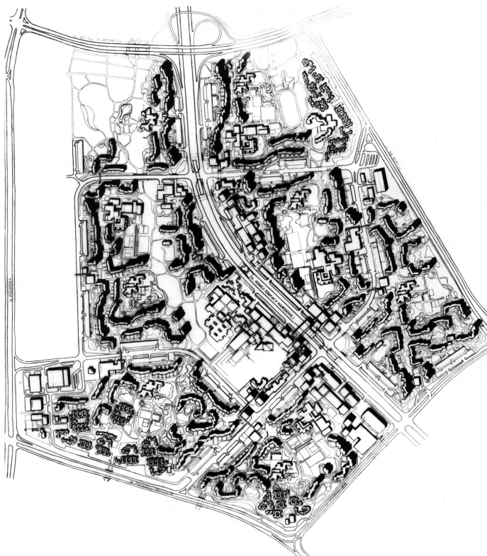
Рис. 1. План Северного Урсынова