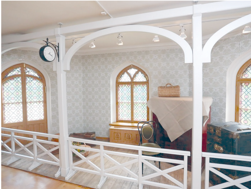
Рис. 8. Историко-культурный проект «Петергофские дачники». Зал «Железнодорожная станция».