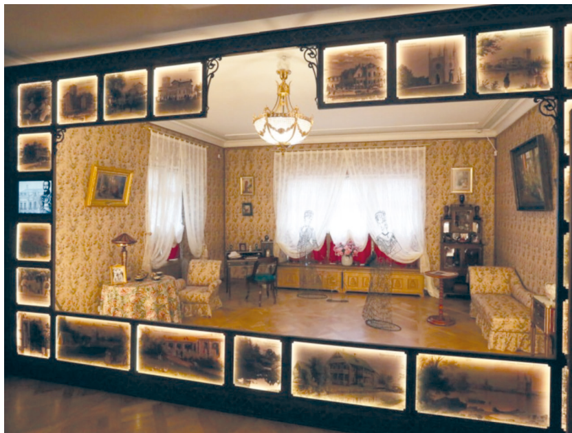
Рис. 12. Историко-культурный проект «Петергофские дачники». Зал «Императорские дачники».

Информационные технологии использованы в этом проекте в принципиально новых вариантах: мультимедиа отходят на второй план, а ведущую роль играет художник — режиссер пространства, который, следуя основной концептуальной идее, создает образ каждого зала. На всем пути зритель встречает в огромных зеркалах отражения таинственных незнакомок в белых платьях и летних шляпах, в одной из них угадывается облик знаменитой дачницы из Стрельны Матильды Кшесинской. В залах стоят необычные предметы: сложноустроенный «шкаф-часы», который, подобно телевизору, «высвечивает» фрагменты дачной жизни, показывая время купания, чаепития, вечерних забав.