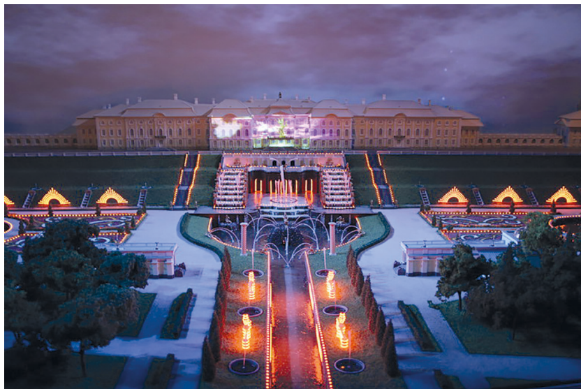
Рис. 4. Историко-культурный проект «Государевы потехи». Зал «Петергофский праздник и иллюминация».

вана историческая иллюминация. Зритель становится участником сразу двух вариантов грандиозного представления, рожденного симфонией воды, огня, музыки и света, — исторического и современного. В центре зала по обе стороны макета располагаются костюмированные персонажи знаменитой поэмы Лермонтова «Петергофский праздник», и все пространство зала наполняется шумом толпы, журчанием падающей воды и шумом фейерверка (рис. 4). Особый интерес представляет мультимедийный стол «Императорские праздники в Петергофе», где их типология разработана и представлена в виде информационно-справочного приложения, при этом свод петергофских праздников создан на документальной основе. На стенах зала расположены впервые введенные в научный оборот материалы из иллюстрированных журналов XIX в. — своеобразные очерки и репортажи о поездках в Петергоф в торжественные дни.