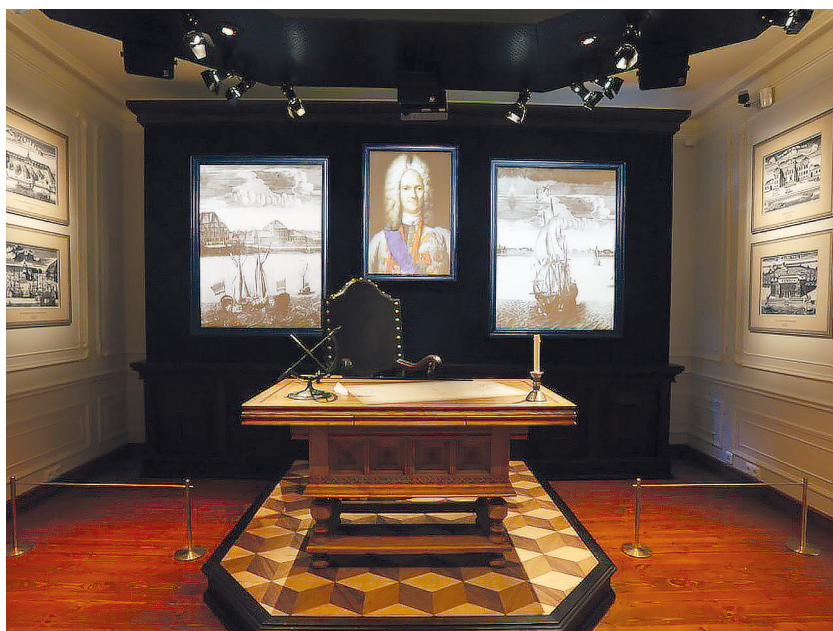
Рис. 14. Историко-культурный проект «Ораниенбаум сквозь века». Рабочий кабинет А. Д. Меншикова.