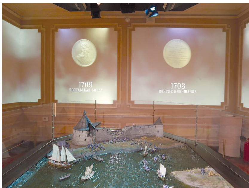
Рис. 13. Историко-культурный проект «Ораниенбаум сквозь века». Зал «Штурм крепости “Орешек”».