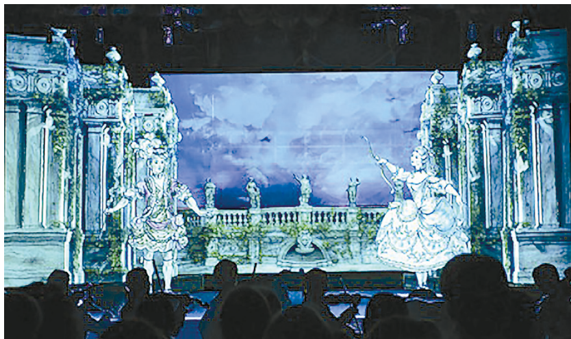
Рис. 7. Театральный зал Картинного дома в Ораниенбауме. Спектакль «Рождение русской оперы».

третий представляет собой законченный фрагмент оперы «Цефал и Прокрис» Франческо Арайи. Необычное представление по сценарию, созданному на основе исторических исследований, подтвержденных документами и артефактами, облеченное в театральную форму, стало следующим шагом на пути внедрения мультимедийных технологий в музейное пространство. Оно ежедневно предлагается вниманию посетителей музея и, входя в каждую обзорную экскурсию по Картинному дому, дарит зрителям эффект реального присутствия на спектакле в зале императорского театра. Мультимедийное решение сценического оформле-