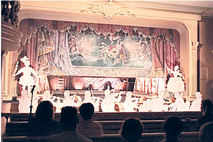
Рис. 6. Театральный зал Картинного дома в Ораниенбауме. Спектакль «Рождение русской оперы».