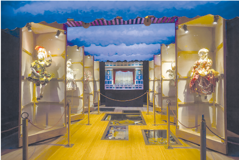
Рис. 3. Историко-культурный проект «Государевы потехи». Зал «Там одна забава следует за другою...» Петергофский театр.

типу исторических поворотными кулисными механизмами. Необычная конструкция позволяет представить сценическую «машинерию» XVIII столетия, а силуэты элегантных дам и кавалеров, написанные на стенах в ложах летнего театра, иллюзорно создают ощущение наполненности пространства театральными зрителями (рис. 3).