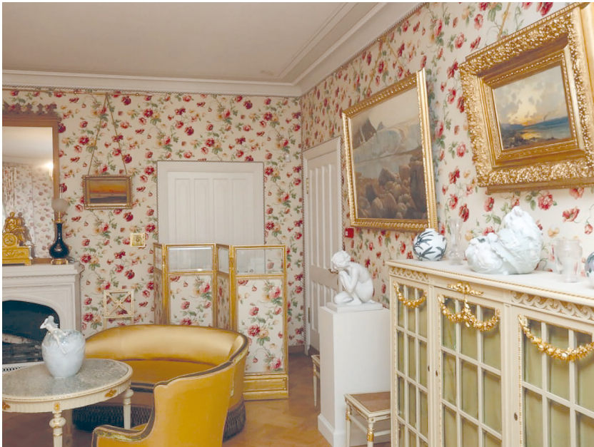
Рис. 10. Историко-культурный проект «Петергофские дачники». Зал «Дамский будуар».