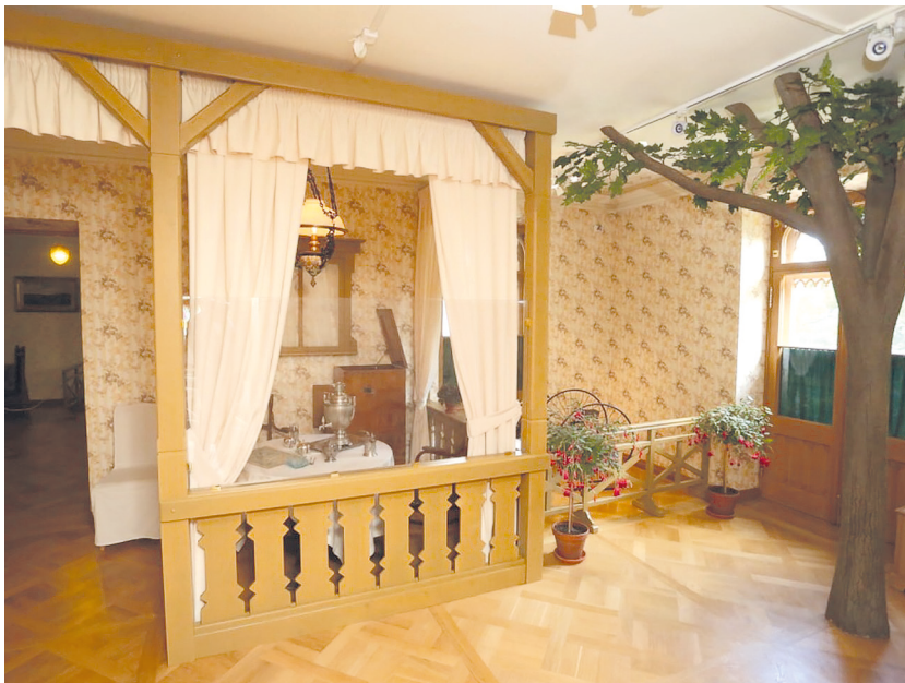
Рис. 9. Историко-культурный проект «Петергофские дачники». Зал «Дачная веранда».