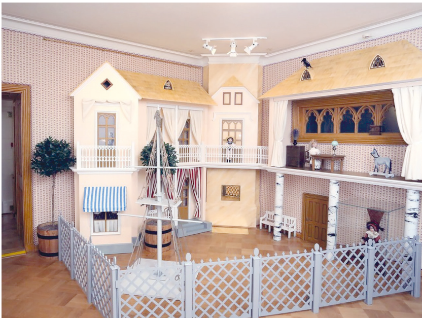
Рис. 11. Историко-культурный проект «Петергофские дачники». Зал «Дачная детская».