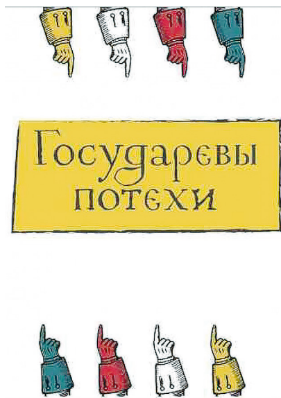
Рис. 1. Фирменный стиль проекта «Государевы потехи».

Специально для проекта «Государевы потехи» был разработан фирменный стиль музея по мотивам работ художника Виталия Ермолаева, подчеркивающий оригинальность нового пространства 5 (рис. 1). Перед началом осмотра залов зрителю предстоит знакомство с установленным на интерактивном столе познавательным игровым приложением, с помощью которого он может узнать, какие личностные особенности русских императоров схожи с его