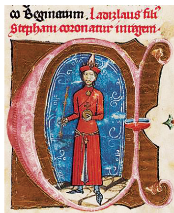
Рис. 9. Миниатюра из манускрипта Chronica de Gestis Hungarorum of Mark Kálti ( Képes Krónika ), 1358–1370 гг. Будапешт, Национальная библиотека им. Сечени