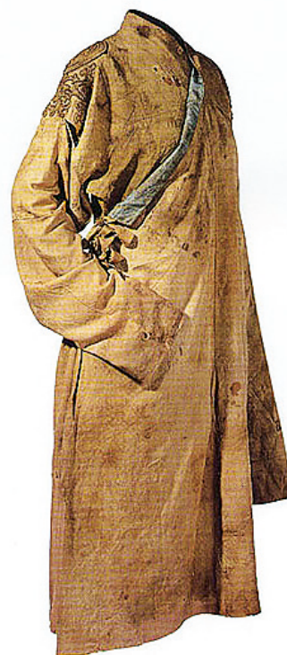
Рис. 3. Монгольский халат эпохи династии Юань, XIII–XIV вв., Rossi & Rossi gallery, Гонконг

Примечательно, что узорные горизонтальные канты на предплечьях, по словам исследователя костюма и вооружения Золотой Орды М. В. Горелика, были редким, заимствованным у иранцев в середине XIV в. элементом монгольского костюма [10, с. 456]. Кроме того, отличичи-