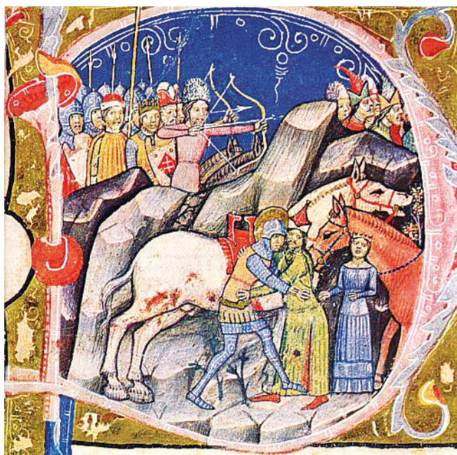
Рис. 15. Миниатюра из манускрипта Chronica de Gestis Hungarorum of Mark Kálti ( Képes Krónika ), 1358–1370 гг. Будапешт, Национальная библиотека им. Сечени

моду на широкие вырезы демонстрирует миниатюра из «Романа и Розе» 4 (рис. 16). Особенно примечательна синяя котта крайней слева девушки, вырез которой открывает белоснежное полотно камизы, как и вырез платья венгерской принцессы (см. рис. 15). Кроме того, весьма интересны другие элементы кроя ее платья (см. рис. 15): широкая декоративная вставка на поясе и плиссированная юбка напоминают рассмотренный ранее куманский кафтан монгольского типа. Юбка платья также украшена декоративной вставкой чуть выше подола.