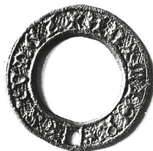
Рис. 8. Пряжка, 1387–1427 гг. Венгерский национальный музей, Будапешт [15, с. 187]