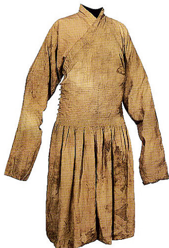
Рис. 5. Монгольский халат эпохи династии Юань, XIII–XIV вв., Rossi & Rossi gallery, Гонконг