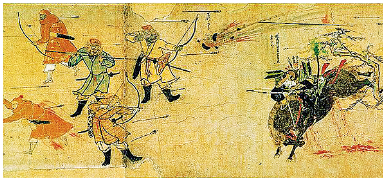
Рис. 2. «Сказание о монгольском нашествии», свиток Тоса Нагатаки, 1292 г.

Рассмотрим восточный тип костюма, разнообразно представленный уже на фронтисписе. Две фигуры справа от короля на переднем плане, по мнению Й. Хита [9, с. 143], вероятнее всего, половцы. Ближе к трону изображен половец с композитным луком в руке. Он одет в длинный, до щиколоток, кафтан, вероятно, из узорного двухцветного (белого с голубым) шелка (саммит, парча или дамаск) на голубом подкладе, который виден на отворотах пол кафтана, с кантом из того же голубого шелка, что и подклад. На ногах обувь из красной мягкой кожи. Головной убор представляет собой остроконечную, вероятно, меховую шапку.