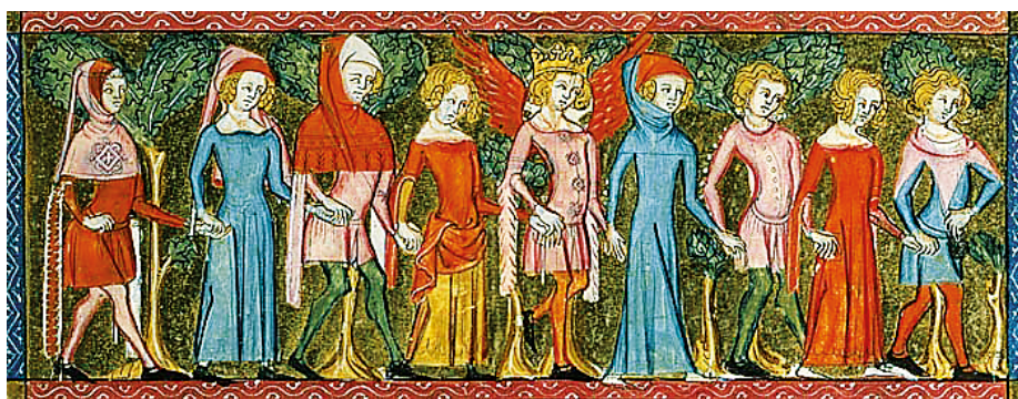
Рис. 16. Миниатюра из книги «Роман о Розе» (Guillaume de Lorris, Jean de Meun, Thomas de Bailleul. “Roman de la Rose”), XIV в., Франция, Французская национальная библиотека

моду на широкие вырезы демонстрирует миниатюра из «Романа и Розе» 4 (рис. 16). Особенно примечательна синяя котта крайней слева девушки, вырез которой открывает белоснежное полотно камизы, как и вырез платья венгерской принцессы (см. рис. 15). Кроме того, весьма интересны другие элементы кроя ее платья (см. рис. 15): широкая декоративная вставка на поясе и плиссированная юбка напоминают рассмотренный ранее куманский кафтан монгольского типа. Юбка платья также украшена декоративной вставкой чуть выше подола.