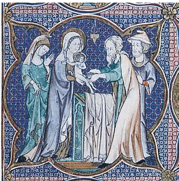
Рис. 14. Миниатюра из манускрипта De Lisle Psalter , около 1330 г., Англия, Британская национальная библиотека

Женский костюм по западноевропейской моде представлен, например, на миниатюре о вторжении венгров в Паннонию (см. рис. 4), на которой присутствуют нескольких женских фигур. Одна из них, незамужняя, судя по непокрытой голове, носит красное сюрко с короткими, до локтей, либо с откидными рукавами, под которым надета светлая котта 3 . На сюрко можно увидеть круглое нагрудное украшение, как на куманских кафтанах, что вновь говорит о смешении западных и восточных элементов. Остальные женщины одеты в плащи. В качестве головных уборов у них платки, которые в XIV в. являлись не столь распространенным атрибутом костюма аристократки. Обратим внимание на то, что эти платки задрапированы скорее по моде XI–XII вв., тогда как в XIV в. платок укладывали, как правило, в виде тюрбана либо иным образом, но так, чтобы шея оставалась открытой. Шею обычно закрывали с помощью барбетта как, например, у крайней слева женщины на миниатюре из английской Псалтыри 1330 г. (рис. 14). Драпировка плата таким образом, чтобы он закрывал шею, характерна для раннего Средневековья.