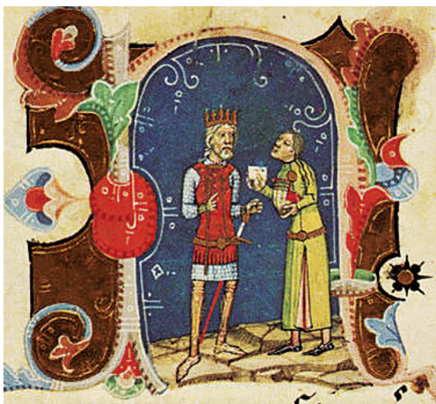
Рис. 10. Миниатюра из манускрипта Chronica de Gestis Hungarorum of Mark Kálti (Képes Krónika) , 1358–1370 гг. Будапешт, Национальная библиотека им. Сечени

оборот, борода и коротко остриженные (по плечи) волосы, что противопоставляет их как европейца и представителя Востока.