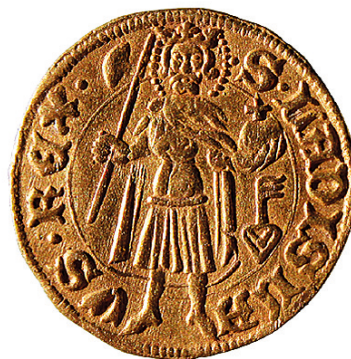
Рис. 6. Золотой венгерский форинт эпохи Сигизмунда Люксембургского [12, с. 6]