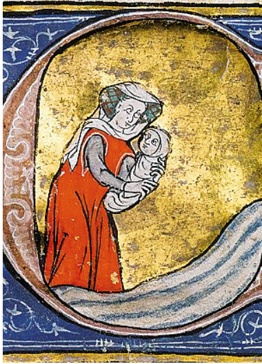
Рис. 12. Миниатюра из книги «Роман о Розе» (Guillaume de Lorris, Jean de Meun, Thomas de Bailleul. "Roman de la Rose"), XIV в., Франция, Французская национальная библиотека