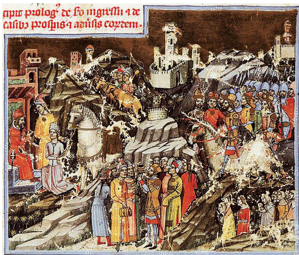
Рис. 4. Миниатюра из манускрипта Chronica de Gestis Hungarorum of Mark Káti ( Képes Krónika ), 1358–1370 гг. Будапешт, Национальная библиотека им. Сечени