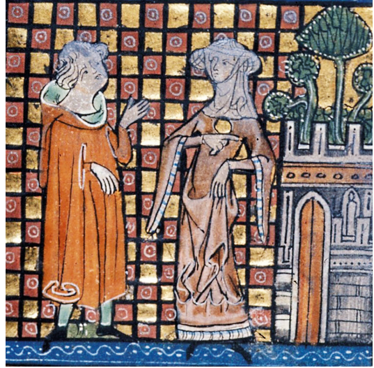
Рис. 13. Миниатюра из манускрипта The Romance of the Grail , XIV в., Амстердам, Библиотека герметической философии (Библиотека Ритмана)

Почти все женщины на миниатюрах носят западноевропейский костюм, который имеет ряд особенностей. Только одна женщина, вероятно, половчанка, одета в платье «на восточный манер» (рис. 11). Она сидит на лошади позади всадника-кумана, на ней платье, схожее по покрою с куманским кафтаном с запахом по монгольской моде. Талия также занижена, судя по поясу, расположенному на бедрах. У платья-кафтана длинные прямые откидные с разрезами рукава. Н. В. Хрипунов отмечает, что такие рукава были характерны не только для западноевропейского готического костюма, но и для монгольского [16, с. 84]. Но в данном случае этот элемент характеризуется, вероятнее всего, именно монгольским влиянием, о чем свидетельствует крой отложных рукавов. Обращает на себя внимание головной убор женщины, который вызывает ассоциации с бургундским головным убором «труффо-орфовре» [14, с. 195]: когда волосы, разделенные на две половины, уложены над ушами таким образом, что напоминают «рожки», и покрыты сеткой и платком из тонкой ткани, часто украшенным фестонами. Варианты такого головного убора можно видеть на миниатюрах XIV–XV вв. Например, на рисунках 12, 13 изображены женщины в «труффо-орфовре» XIV в. Их волосы над ушами уложены в два массивных валика, покрытых плетеной сеткой. Волосы женщины в красном сюрко 1 (рис. 12) прикрыты длинным прямоугольным платом, а другая женщина (рис. 13), будучи незамужней, носит филлет и барбетт 2 .