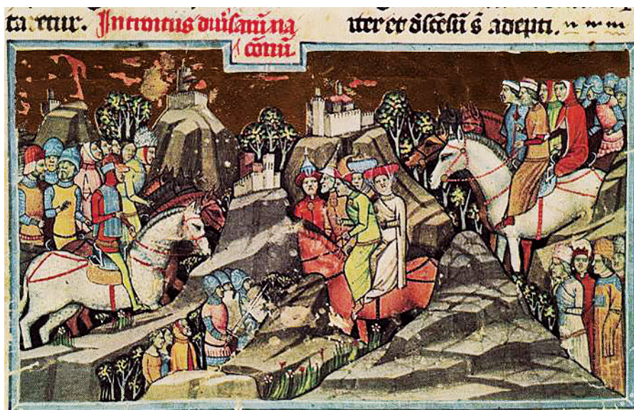
Рис. 11. Миниатюра из манускрипта Chronica de Gestis Hungarorum of Mark Kálti (Képes Krónika) , 1358–1370 гг. Будапешт, Национальная библиотека им. Сечени

Несмотря на то что большая часть миниатюр хроники изображает мужских персонажей, в ней присутствуют и женские фигуры, которые позволяют судить о женском costume.