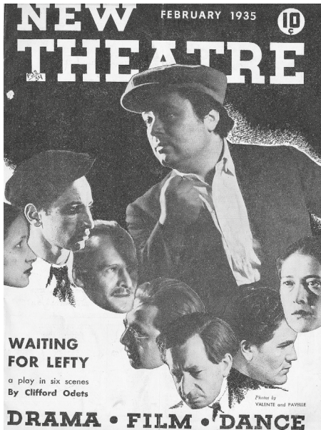
Рис. 5. Обложка журнала «Нью тиэтр». США, Нью-Йорк, февраль 1935 г.

Однако впервые пьеса Одетса увидела свет в журнале «Нью тиэтр» (рис. 5) в неполном варианте — без «Эпизода с лаборантом». Согласно мнению американского исследователя Дж. Уилза, это случилось потому, что история с молодым ученым «дублирует пятый и шестой эпизоды» [24, р. 53], т.е. «Молодой актер» и «Эпизод с молодым врачом». Уилз считает, что эти три сцены выпадают из основного конфликта пьесы: не объясняют, почему таксисты решаются на забастовку, а показывают, кто становится шоферами такси. Для такого радикального пролетарского издания, как «Нью тиэтр», было важно немного уменьшить в пьесе Одетса процент участия в забастовке представителей среднего класса. Неслучайно известный американский драматург и сценарист Дж. Г. Лоусон, убежденный коммунист, также находил слабость пьесы именно в том, что в ней действуют