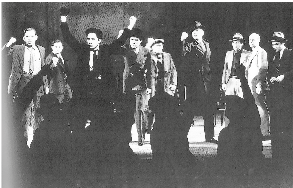
Рис. 2. Финал спектакля «В ожидании Лефти» театра «Груп». США, Нью-Йорк, 1935 г.

Резонанс от постановки превзошел все самые смелые ожидания (рис. 2). «Не прошло и двух минут с того момента, как началась первая сцена “Лефти”, — вспоминал о премьере ее свидетель Г. Клёрман, — а радостное ощущение узнавания волной пробежало по потрясенному залу. <...> Актеры и зрители слились воедино» [18, p. 147–148].