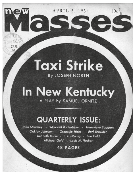
Рис. 3. Обложка журнала «Нью мэссиз». США, Нью-Йорк, 3 апреля 1934 г.