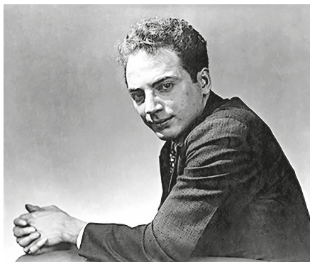
Рис. 1. Клиффорд Одетс. Фото 1935 г.

Однако при всей изученности в нашей стране творчества Одетса в поле зрения отечественных исследователей почему-то никогда не попадал тот факт, что существует не один, а сразу несколько авторизованных печатных вариантов его самой известной у нас (наряду с «Золотым мальчиком») одноактной пьесы — «В ожидании Лефти» (“Waiting for Lefty”). Это обстоятельство способствовало возникновению в российских трудах определенных недоразумений и несоответ-