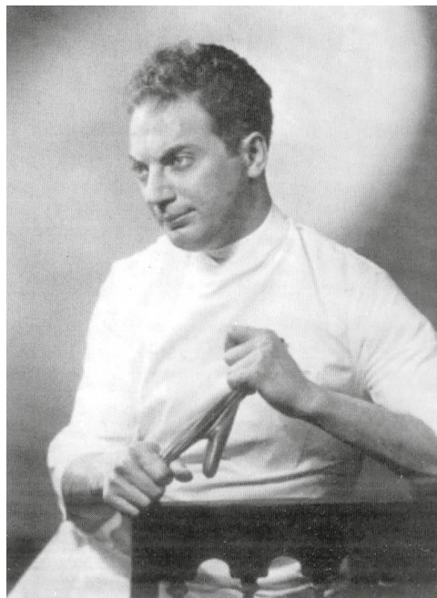
Рис. 4. К. Одетс в роли врача Бенджамина в спектакле «В ожидании Лефти» театра «Груп». США, Нью-Йорк, 1935 г.