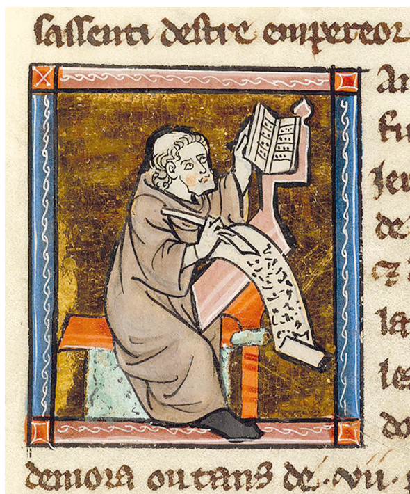
Рис. 2. Святой Иероним на миниатюре в «Кратком изложении божественной истории» ( «Abrégé des histoires divines» ). Франция, возможно, Амьен. Между 1300 и 1310