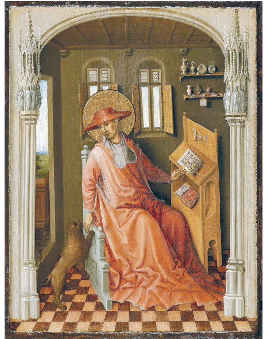
Рис. 15. Стефан Лохнер. Святой Иероним в келье. 1435–1440

(хотя сама коллегия кардиналов появилась через несколько столетий после смерти Иеронима, в XI в.). Иероним в образе кардинала стал популярен в живописи и был закреплен в качестве стандартной иконографии Иеронима в сочинении первой половины XIV в. Джованни д'Андреа «Иеронимиана»: Иероним одет в красную кардинальскую шляпу, или же она лежит рядом, а у его ног находится прирученный лев (Рогир ван дер Вейден «Святой Иероним и лев», 1450 (ил. 14), Ян ван Эйк «Святой Иероним в своей келье», 1432, Стефан Лохнер «Святой Иероним в келье», 1435–1440 (ил. 15) и др.).