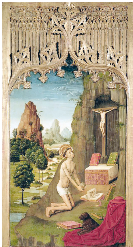
Рис. 3. Мастер из Сео-де-Уржел, Испания. Кающийся святой Иероним. Ок. 1495

Собственно антураж, в который художники помещали кающегося Иеронима, очень условен и варьировался у разных живописцев. Большинство картин представляют его в некоем пейзаже, как правило, далеко от природы реальной Халкидской пустыни, где Иероним провел почти два года (например, у Роберти де Эрколе на картине «Святой Иероним в пустыне», ок. 1470). А у Лукаса Кранаха Старшего буйная растительность, обилие животных, обитающих в европейских