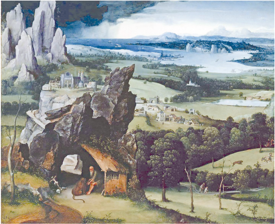
Рис. 5. Йоахим Патинир. Пейзаж со святым Иеронимом. 1520