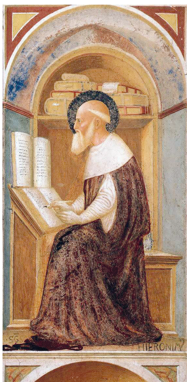
Рис. 1. Мазолино да Паникале. Святой Иероним. Фреска в баптистерии коммуны Кастильоне-Олона, Ломбардия. 1435

Ранняя жизнь святого представлена лишь в редко встречающихся житийных сценах, которые к тому же отнесены на задний план основного изображения и представляют собой дополнение или обрамление последних (как, например, в приделе алтаря Ручеллаи конца XV в. в итальянской церкви Отшельников святого Иеронима во Фьезоле). Иногда догадаться о том, кто изображен на картине, можно только по ее названию либо авторской подписи на полотне. На фреске итальянского живописца (1435) Томмазо да Кристофоро-Фини, более известного под прозвищем Мазолино да Паникале, созданной для баптистерия итальянской коммуны Кастильоне-Олона в Ломбардии, перед зрителем предстает святой в монашеском одеянии за литературной работой в своей келье или скриптории монастыря (ил. 1). И только надпись в правом нижнем углу на латыни указывает нам на Иеронима. Также образ святого, еще без отличительных атрибутов, которые позже станут неотъемлемой частью его живописного изображения, но все же в облике ученого мужа, часто можно увидеть в оформлении средневековых книг (Библии, часословов, breviариев) включенным в инициалы или буквицы. В «Кратком изложении Божественной истории» ( «Abrégé des histoires divines» , Франция, возможно, Амьен,