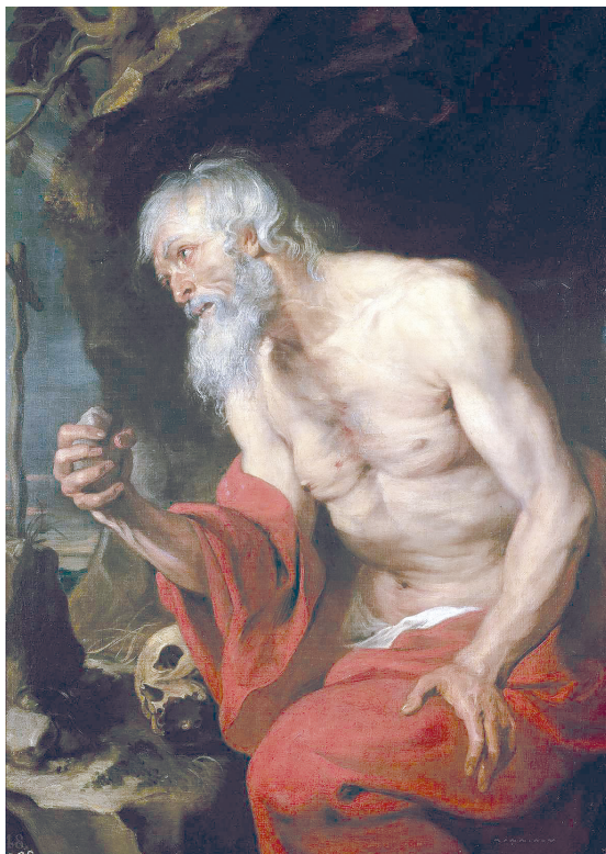
Рис. 4. Антонис ван Дейк. Кающийся святой Иероним. 1618–1620

лесах, и строения на заднем фоне относят зрителя в Германию: «Покаяние святого Иеронима» (1502), «Святой Иероним в скалистом пейзаже» (ок. 1515), «Святой Иероним» (ок. 1525). И тем более это относится к двум его работам «Кардинал Альбрехт Бранденбургский в образе святого Иеронима в пейзаже» (1527 и 1527–1530), где на заднем плане виднеются строения, похожие по архитектуре на северогерманские храмы. Есть изображения кающегося Иеронима в пустыне с ее отличительными признаками: змеями, скорпионами, скудной растительностью (Доменико ди Микелино «Святой Иероним в покаянии», вторая половина XV в.; Фра Анджелико «Кающийся святой Иероним», 1424), а также в пещере. Пещера могла быть как вполне конкретная (Лоренцо Монако «Покаяние святого Иеронима», конец XIV — первая четверть XV в.), так и условная, скорее, это скала, возле которой молился Иероним (Джованни Беллини «Святой Иероним за чтением», 1480–1485; Андреа Мантенья «Святой Иероним в пустыне», 1448–1451; картины Йоахима Патинира «Пейзаж со святым Иеронимом», 1520 (ил. 5), и «Святой Иероним в скалистом пейзаже», 1520, и др.).