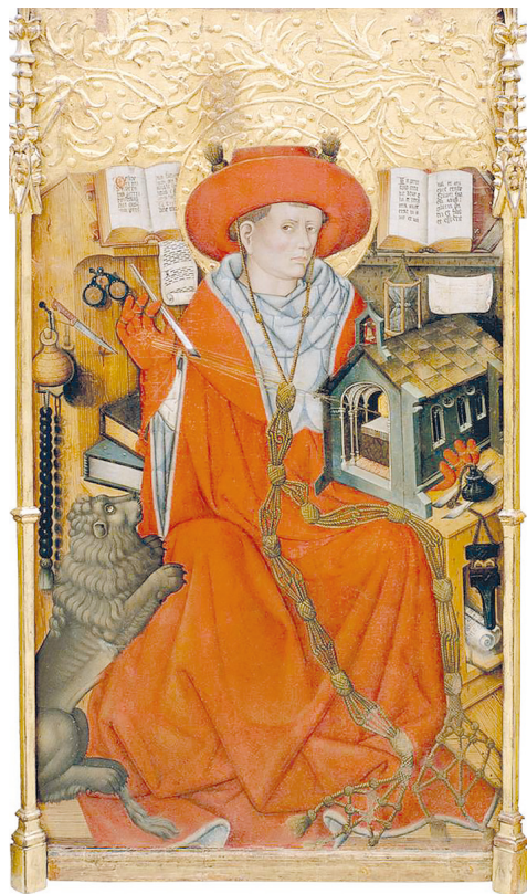
Рис. 10. Жауме Феррер II. Святой Иероним в келье. 1450–1455

В Вифлееме Иероним активно продолжил заниматься переводами и комментированием библейских текстов. В частности, он начал делать новый перевод Ветхого Завета с древнееврейского языка, отказавшись от исправления латинского варианта по греческому тексту Септуагинты. Этот перевод вызвал неоднозначную реакцию у многих христиан, увидевших в этом покушение на авторитет Септуагинты. В результате пришлось потратить много сил на споры и полемику с недоброжелате-