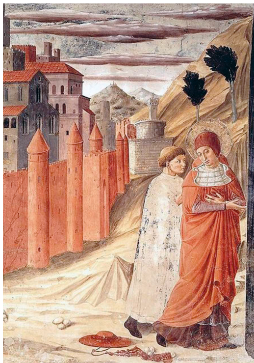
Рис. 7. Беноццо Гоццоли. Святой Иероним покидает Антиохию. XV в.

(1637), у Трофима Биго — «Святой Иероним за чтением» (1630-е), у Антонио де Переда-и-Сальгадо — «Святой Иероним» (1643), у Бернардо Каваллино — «Святой Иероним» (первая половина XVII в.) и др.