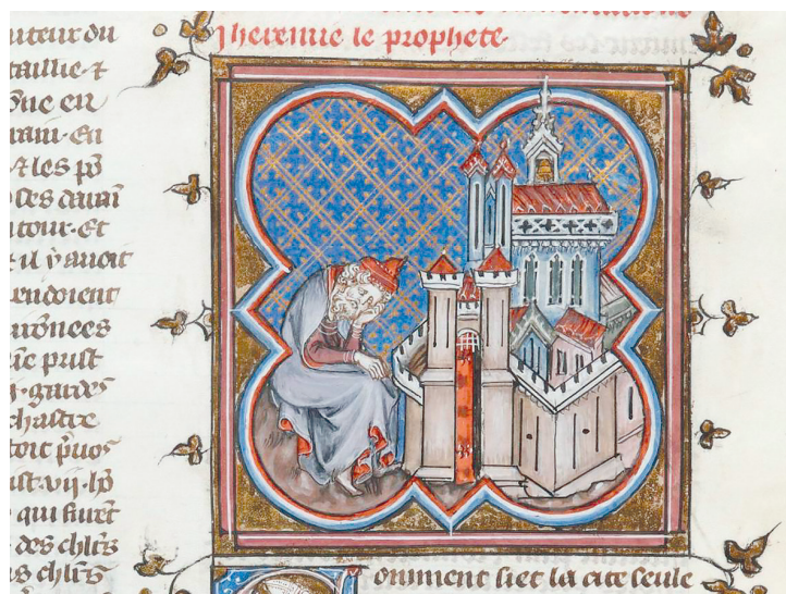
Рис. 12. Ришар де Верден. Иероним оплакивает Иерусалим. Миниатюра из «Полной исторической Библии» ( Bible historique complétée ). 1320–1340

О последних днях жизни Иеронима ничего не известно, так же как и дата его смерти. Общепринятым считается, что это произошло в 419 г. Погребение Иерони-