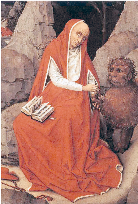
Рис. 14. Рогир ван дер Вейден. Святой Иероним и лев. 1450