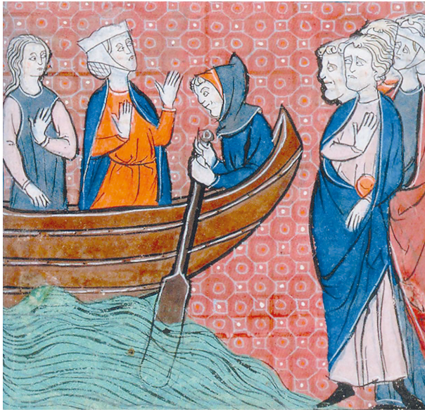
Рис. 9. Святая Павла покидает Рим. Миниатюра из «Золотой легенды» Иакова Ворагинского. Парижские мастерские. Между 1270 и 1280

нове фрагментов из «Послания CVIII» святого Иеронима и проиллюстрированная в некоторых изданиях этой книги миниатюрой. Например, в рукописи «Золотой легенды», созданной в Парижских мастерских между 1270 и 1280 гг., помещена миниатюра «Святая Павла покидает Рим» (ил. 9). Это, пожалуй, единственный сюжет, где Павлу можно видеть без Иеронима.