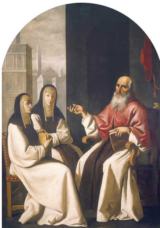
Рис. 8. Франсиско де Сурбаран. Святой Иероним со святыми Павлой и Евстохией. 1640–1650

Иероним-учитель нашел свое отражение и в живописи, в первую очередь как наставник для своих любимых духовных дочерей Павлы и Евстохии. Их изображения встречаются нечасто, причем и Павла, и Евстохия представлены почти исключительно в сопровождении Иеронима: на картинах Франсиско де Сурбарана «Святой Иероним со святыми Павлой и Евстохией» (1640–1650; ил. 8), Франческо Боттичини «Святой Иероним в покаянии со святыми и покровителями» (1490–1498), также их можно видеть на витражах церквей (например, на витраже первой четверти XX в. «Святая Павла и святой Иероним» в парижском храме Нотр-Дам-де-Клиньянкур). Позднее Павла была канонизирована. Она умерла в 404 г., на 15 лет раньше Иеронима, который написал ее житие. Преподобная Павла поминается вместе с Иеронимом в «Палестино-грузинском календаре» 28 августа, в Месяцеслов Русской православной церкви данная память не включена, а Западная церковь отмечает ее память 22 января. В собрании житий святых и христианских легенд монаха-доминиканца Иакова Ворагинского «Золотая легенда», написанном в XIII в., Павле посвящена отдельная глава «О святой Павле», составленная на ос-