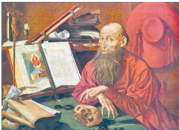
Рис. 11. Маринус ван Реймерсвале. Святой Иероним в келье. 1541

Принимал Иероним участие и в полемиках по различным вопросам, причем делал это бескомпромиссно, с присущей ему горячностью и увлеченностью, порой не стеснясь в выражениях. Такое отношение к своим оппонентам приводило и к проблемам. Например, в результате спора об учении Оригена Иоанн Иерусалимский (поклонник Оригена) в 393 г. лишил Иеронима и монахов его монастыря церковного