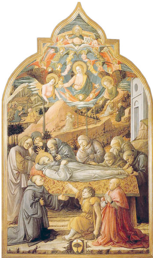
Рис. 13. Фра Филиппо Липпи. Похороны святого Иеронима. 1460–1465

ся и легендарные факты из его жизни. В дальнейшем мифические истории и легенды продолжали появляться с завидной регулярностью, причем основное внимание в них уделялось чудесам и аскетическим подвигам Иеронима. Неизвестным автором (или авторами) сочиняется серия подложных писем Иеронима, а в первой половине XIV в. создается даже целое собрание также подложных писем современников Иеронима с подобными рассказами. Они производили сильное впечатление не только на простых читателей и верующих, но и на художников. Легендарные факты из жизни Иеронима нашли свое отражение в творчестве многих художников не меньше, чем реальные события. Это касается, например, такого сюжета, как «Отшельник со львом» из «Золотой легенды» (ок. 1260) Иакова Ворагинского. В легенде рассказывается, что однажды в монастырь, где настоятелем был святой Иероним, пришел хромой лев (есть вариант, когда Иероним сам приводит льва в монастырь), монахи в ужасе разбежались, а Иероним помог зверю — бесстрашно вытащил застрявшую в лапе колючку. В благодарность за избавление от страданий лев остался в монастыре на услужении — присматривал за ослом, на котором монахи перевозили хворост.