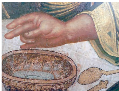
Рис. 18. Рука ангела. Фрагмент живописи иконы «Святая Троица»