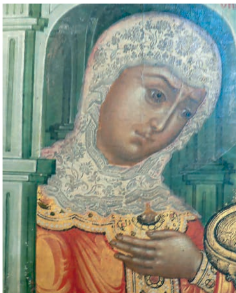
Рис. 14. Праведная Сарра. Фрагмент живописи иконы «Святая Троица»

Особая роль в композиции гledenского шедевра отведена ритму, объединяю-