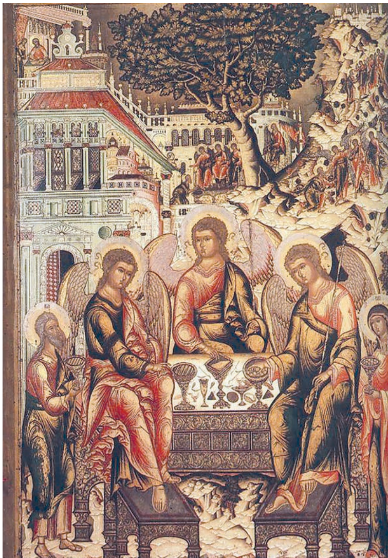
Рис. 3. Святая Троица. 1659 г. Икона из церкви Святой Троицы в Никитниках

На древнерусских иконах Святой Троицы, в краткой или пространной иконографической редакции, небесные вестники обычно вовсе не бросают взгляда на зрителя, или на него взирает только средний из них. Исключение составляют немногие «изокефальные» версии, в которых ангелы демонстрировались сидящими в ряд, фронтально, в одинаковых позах и одеждах и глядящими на нас 16 , и единичные примеры совмещения данного признака с «рублевской» иерархически организованной схемой, притом с гораздо менее выразительной его интерпретацией