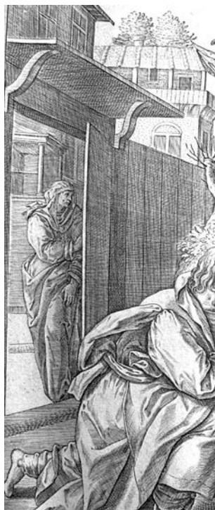
Рис. 7. Святая Сарра, слушающая пророчество. Фрагмент гравюры «Гостеприимство Авраама» из Библии Пискатора 1646 г.