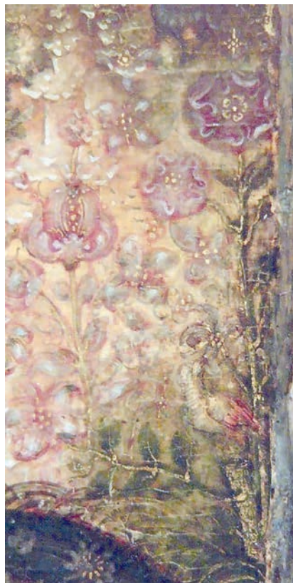
Рис. 24. Фрагмент пейзажа с иконы «Святой Иоанн Предтеча». Середина XVII в. ГТГ