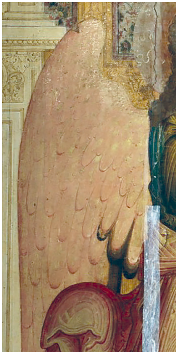
Рис. 26. Крыло архангела Гавриила. Фрагмент живописи иконы «Благовещение» 1660–1662 гг. Федор Зубов и мастерская

Каждое длинное перышко внутренней нежно-розовой части крыл покрыто частыми параллельными золотыми штрихами. Белые кроющие перышки меньшего размера в верхней их части сформированы в орнаментальный ряд из треугольников. Плечи и предплечья крыльев мастер своеобразно выделил, придав им вид белой четко очерченной змеевидной ленты. Краски, использованные при написании крыл (красная, розовая, белая), тают в свечении ассистных лучей, что придает им огнеподобный вид.