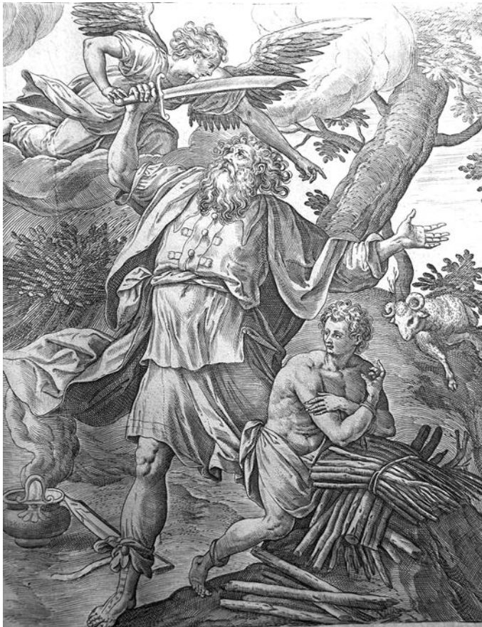
Рис. 5. Жертвоприношение Авраама. Фрагмент гравюры Библии Пискатора 1646 г.

В связи с иконографией образа «Святая Троица» из Троице-Гледенского монастыря отдельное внимание необходимо уделить сценам «Жертвоприношение Авраама» и «Сарра, ожидающая гостей». Особенности их трактовки говорят о прямом или опосредованном знакомстве иконописца с западноевропейскими иллюстрированными изданиями, а именно с ветхозаветным циклом Библии Пискатора 22 . По своему интерпретировав образец, мастер сохранил его композиционную основу. В изображении жертвоприношения Авраама переданы характерные взаиморасположения фигур Исаака, Авраама и ангела, специфические движения этих героев, даже детали (дымящийся котелок и сложенные дрова), которые можно увидеть на одноименной гравюре из Библии Пискатора (рис. 4, 5). Сложнее обстоит дело со