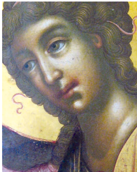
Рис. 11. Ангел. Фрагмент живописи иконы «Святая Троица» Симона Ушакова 1671 г. ГРМ

Здесь не найти таких «ушаковских» примет, как подчеркнутая плавность в абрисе овала лица, а в изображении глаз — намеченной толщины нижнего века. Зато мы обнаруживаем отсутствующие в «живоподобной» системе разгранку на две части глазной впадины, широко распахнутые глаза с оттянутыми стрелкой «внешними» краями и некоторые другие восходящие еще к «строгановской» иконе начала XVII в. черты, например жирную обводку нижнего контура верхнего века. С точки зрения логики организации черт личного письма иконы Федора Зубова из церкви пророка Ильи и гледенская «Троица» находят аналогии в некоторых других произведениях середины XVII в., принадлежащих «роскошному» стилю, например в образах «Спас Нерукотворный» (ВУМЗ) и «Спас Эммануил» (МиАР).