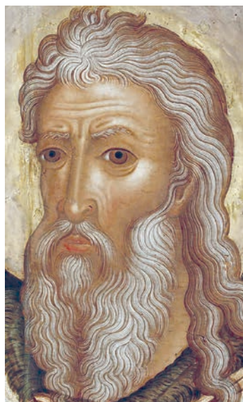
Рис. 13. Пророк Илия. Фрагмент живописи иконы «Пророк Илия в житии» 1660–1662 гг. Федор Зубов и мастерская

надбровных дуг и переносицы, морщин на лбу, носогубных складок; узнаваемая графическая разделка волос (белые тончайшие нити на коричневом фоне, четкое деление каждого «уса» на малую и длинную пряди и т. д.). В образе Авраама, в сравнении с ликом Ильи, заметно снижена степень экспрессивности, так как он, в отличие от пророка, не является «главным действующим лицом» произведения.