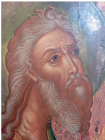
Рис. 12. Праведный Авраам. Фрагмент живописи иконы «Святая Троица»

рафинированная утонченность достигнута за счет удлинённости пропорций: высокой шеи, протяженных прядей седых волос, плавных, немного манерных черт лица. Показательно его сравнение с фигурой пророка Ильи на иконе «Пророк Илия в житии» из Ильинского ярославского храма (рис. 13). Нутровую близость двух ликов трудно исчислить списком признаков сходства. В обоих случаях взгляд привлекают напряженный «дальний» контур лика со «вдавленной» по отношению ко лбу и бороде скулой и выпуклой «линзой» верхнего века; одного типа рисунок