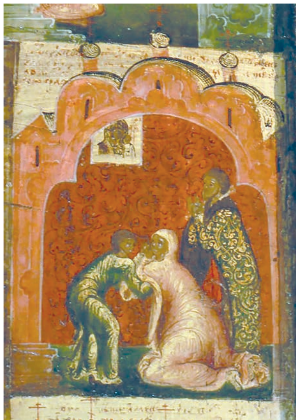
Рис. 22. Клеймо рамы с чудесами Богоматери Казанской. Вторая четверть XVII в.

зует его обильно и при этом никогда не дает ему свободы, не делает его самодовлеющим элементом формы. Узор повсюду подчинен предмету, на котором он выведен. В этом смысле очень красивы белые орнаментированные ткани: скатерть на столе и плат на голове Сарры. На плате мы находим сразу три типа узоров: ленту из О- и Х-образных элементов, живописно разбросанные по поверхности цветы и над челом Сарры — орнаментальную ленту из чередующихся трилистников двух видов. На «вафельной» скатерти узоры формируют сетку, в каждый квадрат которой вписан четырехлепестковый цветок. По ее канту пущен ряд из парных стилизованных белых цветков двух типов. Узоры на плате и скатерти бесцветные: серые на белом или наоборот. Бледные, не сразу различимые, они удивляют изяществом, тонкостью исполнения, напоминают морозные разводы на стекле. Подобные приемы изображения светлых тканей со светлыми же узорами были хорошо известны в искусстве Великого Устюга середины XVII ст. Чтобы в этом убедиться, достаточно вспомнить охристый омофор с полупрозрачными белыми кругами, заполненными легкими стеблями с небольшими листиками, на уже упоминавшейся выше небольшой иконе «Святитель Николай Чудотворец» (ВУМЗ), приписываемой Федору Зубову, и образ «Спас Нерукотворный» (ВУМЗ), где плат покрыт частыми полосками, между которыми рядами «высыпаны» мелкие золотые точки (рис. 8).