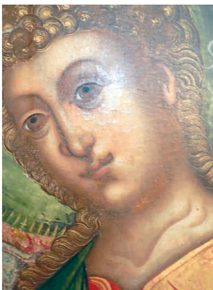
Рис. 10. Ангел. Фрагмент живописи иконы «Святая Троица»

го письма этих произведений 37 . Среди приметных черт их стиля — мощь пластики, «скульптурная» материальная весомость представленных на них персонажей. В этой выявленности «телесного», безусловно, есть определенное созвучие живоподобным образам. И все же трактовка изображения плоти на иконах Оружейной палаты в варианте Симона Ушакова 1660–1670-х годов и на гледенском и ильинских образах существенно различается. Разница проступает в том числе в физиономических особенностях (рис. 10, 11, 8).