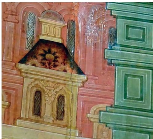
Рис. 21. Палаты. Фрагмент живописи иконы «Благовещение» 1660–1662 гг. Федор Зубов и мастерская

происходящей из Никольской церкви деревни Ньюба (СИХМ) [42, кат. 63, с. 69–70, 187; 43, с. 96–100], более сложную, чем на «строгановских» иконах рубежа XVI — начала XVII в., но более простую, чем на иконах «Святая Троица» из Троице-Гледенского монастыря и на иконах Федора Зубова из ярославской Ильинской церкви (рис. 22). Здесь в клеймах палаты украшены широкими арками. Стены виднеющихся сквозь них покоев покрывает «черневой» узор из небольших завитков и цветов 41 . В палатном письме нубской рамы мы находим и знакомый колористический аккорд из светло-зеленого, розового и охристого, затенение ниш с градациями в тоне основного цвета, курчавый архитектурный декор фасадов и в нем — даже аналогичные килевидные арочки.