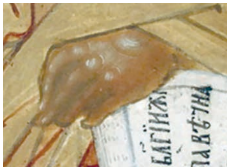
Рис. 17. Рука апостола Петра. Фрагмент живописи иконы «Апостольская проповедь» 1660–1662 гг. Федор Зубов и мастерская