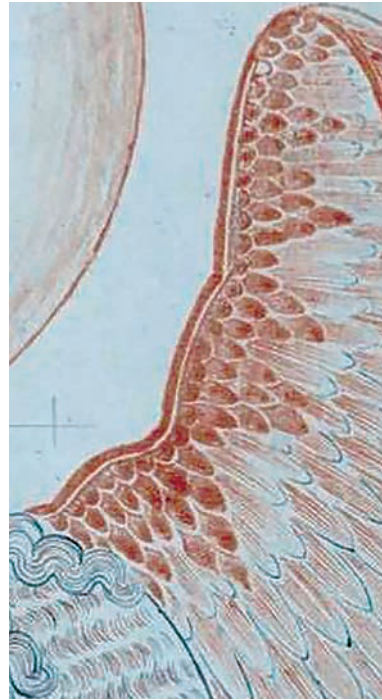
Рис. 28. Фрагмент прориси с иконы Федора Zubова «Иоанн Предтеча — Ангел пустыни»

нописного подлинника (рис. 28) [54, л. 221], которая позволяет составить представление о первоначальном виде показанных на иконе крыл. В произведении из Антониево-Сийского монастыря прочитывается во всей сложной полноте структура живописи крыльев, так удивляющая в гледенской «Троице». Тут и сложенные треугольниками перышки, и упругая графика контура крыльев. Степень близости, как нам представляется, простирается за границы иконографии (и за пределы иконографии крыльев), но позволяет говорить о большом сходстве образно-художественной природы двух икон.