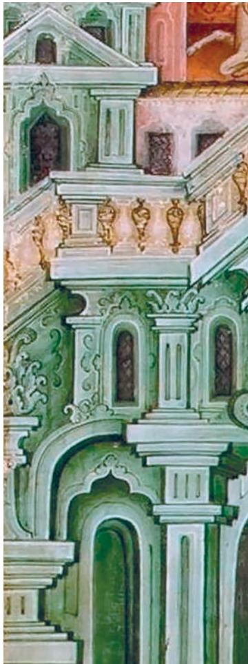
Рис. 20. Палаты. Фрагмент живописи иконы «Святая Троица»