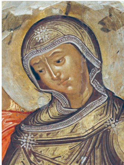
Рис. 15. Богоматерь. Фрагмент живописи иконы «Вознесение Господне» 1660–1662 гг. Федор Зубов и мастерская

щему движение рук сидящих за столом ангелов. Эта ритмическая организация не имеет ничего общего с «рублевским» решением. Можно проследить, как от левой руки ангела, находящегося справа, к правой руке ангела, размещающегося слева,