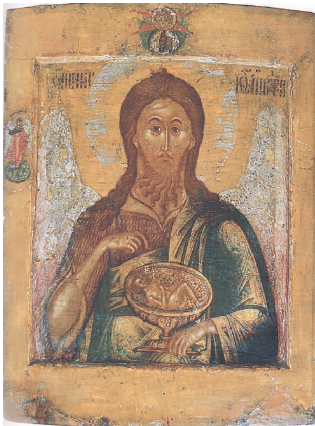
Рис. 9. Иоанн Предтеча — Ангел пустыни. Федор Зубов. Середина XVII в.

в Ярославль. В 1660–1662 гг. он создал наиболее важные для понимания всего его творчества произведения — иконы ярославской Ильинско-Покровской церкви (эти сроки пребывания мастера в Ярославле были определены Т. Е. Казакевич) 34 . Ансамбль сохранился до нашего времени, в него входят большого размера иконы «Илья Пророк в пустыне», «Покров Богоматери», «Иоанн Предтеча — Ангел пустыни», «Вознесение Господне», «Благовещение Пресвятой Богородицы», «Апостольская проповедь», «Богоматерь Владимирская», «Святители в предстоянии Богоматери Знамение» и клейма рамы с «Акафистом Богоматери» вокруг иконы «Богоматерь Тихвинская». По завершении этих работ он уехал в Москву и в 1662 г. был зачислен в штат Оружейной палаты [49, с. 120].