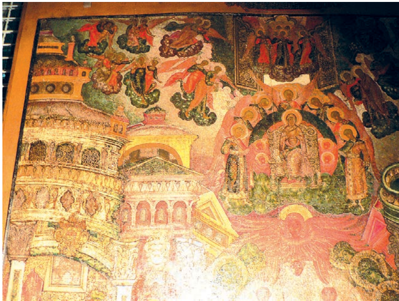
Рис. 2. Успение Богоматери. 1672 г. Фрагмент живописи иконы мастера Сергея

Среди сохранившихся икон, происходящих из Троицкого Гледенского монастыря: «Спас Нерукотворный» 9 , «Успение Богоматери» 1672 г. (рис. 2) 10 и «Сошествие Святого Духа» 1676 г. 11 мастера Сергея 12 , «Святитель Николай Чудотворец» и «Одигитрия» 1698 г. работы Стефана Нарыкова (все — ВУМЗ) 13 — нет близкой стилистической аналогии образу «Святая Троица». В то же время стилистические