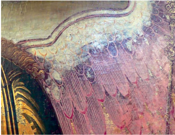
Рис. 25. Крыло ангела. Фрагмент живописи иконы «Святая Троица»

Завораживают в гледенской «Троице» ангельские крылья, подобных которым нет ни на одной другой иконе (рис. 25). Их живопись производит сложное впечатление. Здесь легкость сочетается с силой, ирреальная красота — с осязаемой энергией.