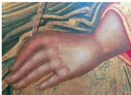
Рис. 16. Рука ангела. Фрагмент живописи иконы «Святая Троица»

под очень низким углом восходит незримая линия, а затем, меняя свое направление в противоположную сторону, столь же плавно направляется к левой руке небесного вестника, сидящего в середине. Стоит отметить, впрочем, что пересекающиеся пологие диагонали — не только «каркас» данной части композиции, но и один из основных принципов построения композиции всей иконы. Руки странников, гостей у Авраама, завораживают красотой своей формы. Крепкие, округлые, с короткими сильными пальцами, в их строении акцентирована каждая мышца, кругами обозначены суставы. Так писал руки святых и ангелов Федор Зубов. В поисках иконографико-стилевых аналогий для самых разных изображений рук на иконе «Святая Троица» мы вновь и вновь возвращаемся к ильинскому ансамблю начала 1660-х годов и находим аналогии для левой руки правого ангела в изображении левой руки апостола Петра из «Апостольской проповеди» (рис. 16, 17), для благословляющей десницы этого же ангела — в изображении указующей в небо руки ангела с иконы «Вознесение Господне» и правой руки Спасителя на иконе «Апостольская проповедь» (рис. 18, 19) etc.