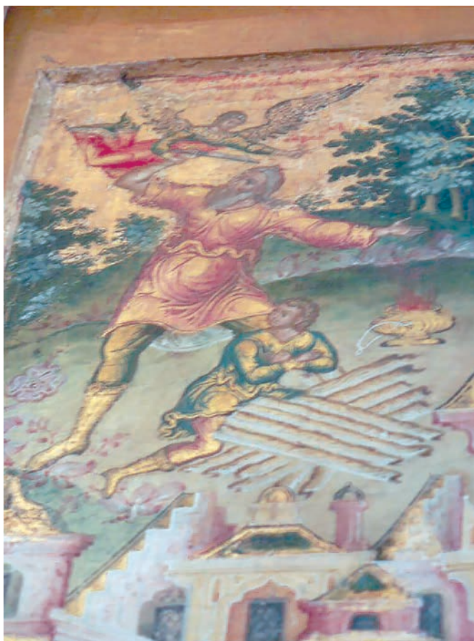
Рис. 4. Жертвоприношение Авраама. Фрагмент живописи иконы «Святая Троица» из Троице-Гledenского монастыря

В цикл «деяний» на иконе из Гledenского монастыря включены сцены «Гибель Содома» и «Жертвоприношение Авраама» (рис. 4). Наиболее драматичные из всех, они расположены симметрично в верхних углах. В виде клейм обе композиции можно встретить в древнерусской живописи уже во второй половине XVI ст., например на иконах второй половины XVI в.: из Покровского монастыря в Суздале (до 1587 г.) (ГРМ) [32, с. 55] и из бывшего собрания А. В. Морозова (ГТГ) [5, с. 162–163]. Известны также случаи их включения в композицию икон со сценами Бытия на дальнем плане, хотя в подобных произведениях их изображали далеко не всегда.