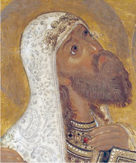
Рис. 23. Святитель Леонтий Ростовский. Фрагмент живописи иконы «Святители в предстоянии Богоматери Знамение» 1660–1662 гг. Федор Зубов и мастерская

в молении перед Богоматерью» 50–60-х годов XVII в. из Иосифо-Волоколамского монастыря (ГРМ) [39, ил. на с. 135], «Святитель Николай» последней четверти XVII в. из церкви Воскресения села Остров Гаврилов-Ямского района Ярославской области (ЯХМ) [28, кат. 113, ил. на с. 139]. Он украшает омофор святителя Николая на иконе из Великоустюгского музея. Всякий раз мотив приобретал особую трактовку, его детали могли истончаться, а сам он образовывал то ровную полосу, то вьющуюся ленту. В этом смысле орнаментальный ряд, декорирующий плат Сарры на иконе «Святая Троица» из Гledenского монастыря, находит ближайшую аналогию в изображении узоров на рубашках ангелов и по канту мафория Богоматери на иконе «Вознесение Господне» из Ильинского храма: орнамент показан серебряным, заключен в двойную рамку из тонкой внутренней и более широкой внешней полосы и идет не прямо, но извиваясь и перекручиваясь косичкой 43 .