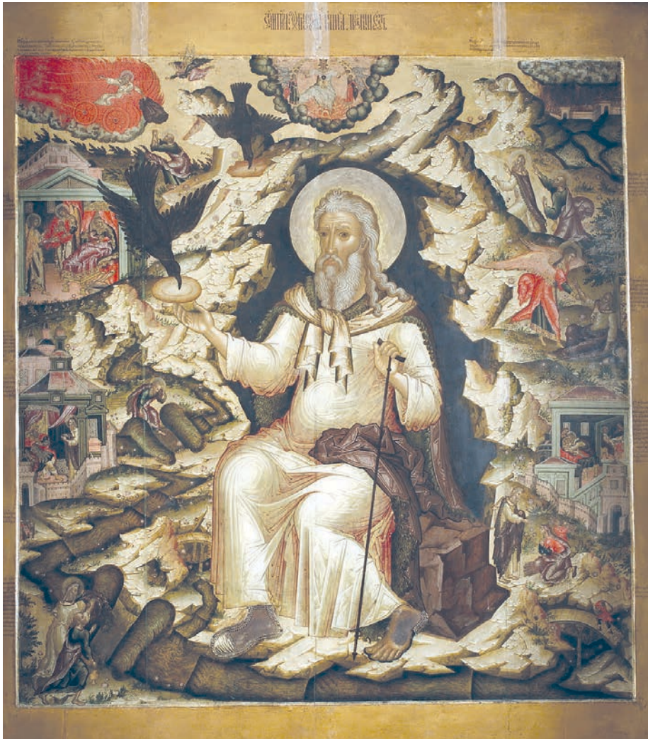
Рис. 29. Пророк Илия в житии. Икона 1660–1662 гг. Федор Зубов и мастерская

один пример. В числе близких иконографических аналогий иконе «Ветхозаветная Троица» из Великоустюгского музея исследователями указывался одноименный образ 1659 г. из церкви Троицы в Никитниках (рис. 1, 3, 29). На обеих иконах