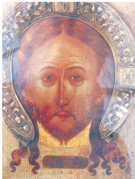
Рис. 8. Спас Нерукотворный. Икона середины XVII в.

дователей факта существования «роскошного» стиля, который был связан именно с иконой. Интуитивно его бытие провидели И. Е. Данилова и Н. Е. Мнева, давшие точную характеристику его свойствам, описывая одно произведение — «Благовещение с Акафистом» 1659 г. из московской церкви Святой Троицы в Никитниках. Описание заканчивается словами, с которых уместно начать наши рассуждения: «Икона... свидетельствует о том, что в конце 50-х гг. в живописи Москвы существовали различные направления, среди которых ушаковскому направлению не принадлежало первенства» [35, с. 374] 26 . Среди множества стилистических направлений этого времени первенство принадлежало именно тому, за которое предстательствует живопись никитниковского «Благовещения». Речь идет о придворном стиле первых пятнадцати лет царствования Алексея Михайловича Романова.