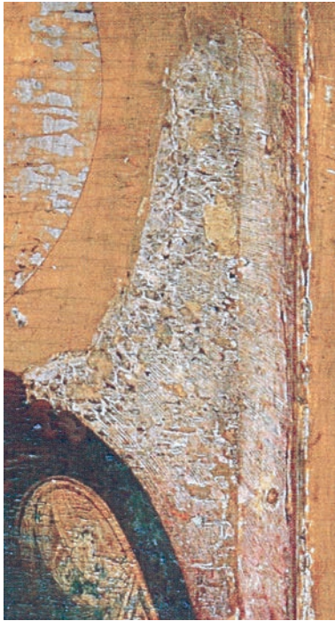
Рис. 27. Фрагмент живописи иконы «Иоанн Предтеча — Ангел пустыни». Федор Zubov. Середина XVII в.