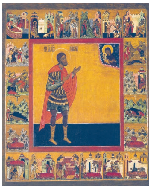
Рис. 7. Великомученик Никита в житии. Конец XVI в. Вклад Никиты Григорьевича Строганова. СИХМ