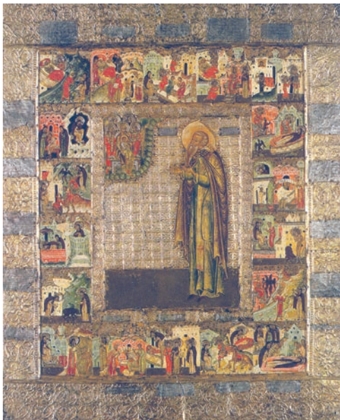
Рис. 12. Преподобный Феодор Сикеот. Третья четверть XVII в. Вклад Федора Петровича Строганова. СИХМ