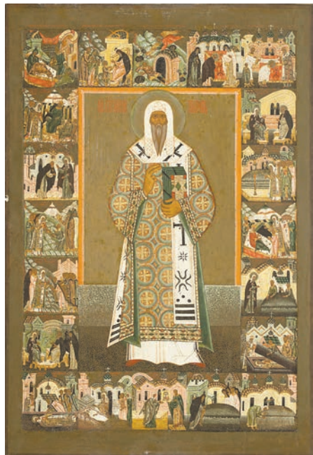
Рис. 11. Святитель Алексий митрополит Московский в житии. Не позднее 1586 г. Вклад Семена Аникиевича и Максима Яковлевича Строгановых. СИХМ