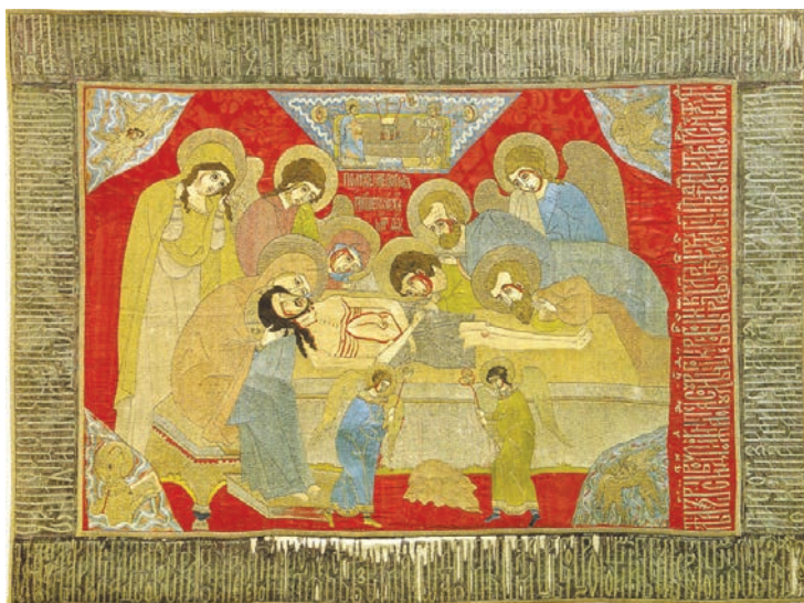
Рис. 5. Положение во гроб. Шитая плащаница. 1592 г. Строгановская мастерская. Вклад Никиты Григорьевича Строганова. ГРМ