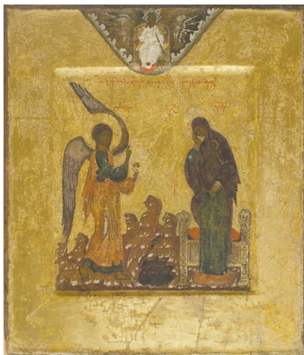
Рис. 3. Благовещение Пресвятой Богородицы. «Начальный образ». Ок. 1558 г. СИМХ