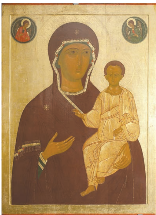
Рис. 8. Богородица Одигитрия. «Мирское поставление». 1570-е годы. СИХМ