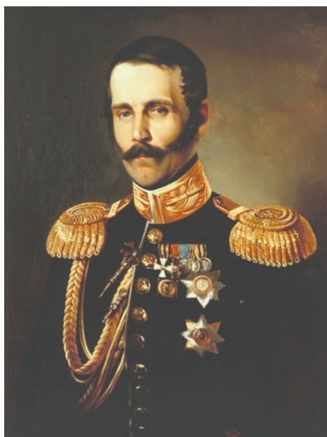
Рис. 2. С.П.Юшков. Портрет Сергея Григорьевича Строганова. 1853 г. Пермская художественная галерея