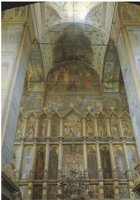
Рис. 10. Благовещенский собор Сольвыгодска. Вид на предалтарный иконостас