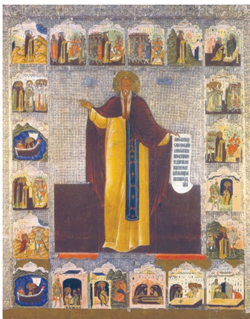
Рис. 6. Истома Гордеев (?). Преподобный Максим Исповедник в житии. Конец XVI в. Вклад Максима Яковлевича Строганова. СИХМ