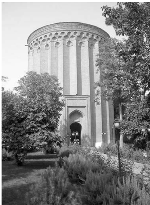
Рис. 2. Гробница Тогрула — основателя династии Великих Сельджуков. Иран, Рей, XII век

ных Великих Сельджуков противостоять внутренним и внешним врагам; но борьба между Латинскими государствами и Фатимидами позволила ветвям потомков Дома Сельджука уцелеть. Правда ненадолго: уже в 1141 г. султан Санджар в борьбе с каракитаями утратил контроль над Средней Азией, а после его смерти в 1157 г. прекратилась власть Великих Сельджуков и в Хорасане. Дом Великих Сельджуков формально просуществовал до 1194 г., однако попеременно усиливавшиеся локальные правители признавали его формальный сюзеренитет лишь периодически в своих политических интересах. Несколько ветвей династии — керманская, сирийская — не дожили до начала XIII века, и лишь Сельджуки Рума смогли не только лавировать между Византией, Фатимидами, крестоносцами, сирийскими Айюбидами, но и, подчинив себе княжества Анатолии, стать в начале XIII века сильнейшим мусульманским государством, принявшим волну иранских беженцев в начале похода монголов и воспринимавшимся как последний оплот ислама.