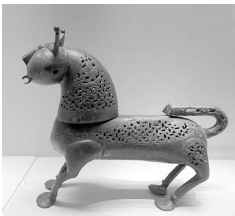
Рис. 4. Сельджукская курильница в виде льва. Бронза. Иран (?), XII век. Лувр.

Уже в первое столетие существования ислама на завоеванных арабами землях сформировался тип дворовой (колонной) мечети, пространство которой состоит из открытого двора и молитвенного зала с плоским или двускатным перекрытием, опирающимся непосредственно на несущие столбы (колонны) либо на аркады. В ряде случаев перекрытие зала могло дополняться куполом — либо в центре среднего нефа (Дамаск, Алеппо), либо над михрабной ячейкой (в иерусалимской аль-Акса и во многих магрибинских мечетях — в торцах повышенного центрального нефа, акцентируя планировочную ось). Таковы ранние мечети Сирии, Месопотамии (Харран), Иордании, Египта (Фустат), Туниса (Сусс, Кайруан), Марокко, Испании. Иконография исламской архитектуры «во многом исходила из уже существовавшей строительной практики и образной системы предшествующего культового зодчества. Богатейшее наследие ближневосточной культовой архитектуры давало мусульманам право выбора от гипостильных залов до зданий базиликального типа, купольных базилик и центрических купольных построек» [4, с. 27].