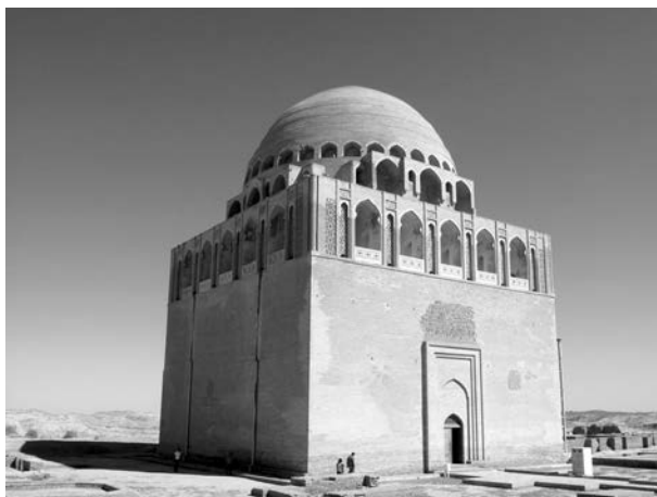
Рис. 5. Мавзолей султана Санджара. Туркмения, Мерв, XII век

сятся к XII веку (если не принимать во внимание строительство в них новых айванов при Тимуридах и Сефевидях), а наиболее показательные (в Верамине, Тебризе) — к XIV веку; в Средней Азии в XII веке мечети оставались дворовыми. Мечеть в Дамгане с одним айваном, встроенным в перекрытый куполами центральный неф молитвенного зала, датируется ок. 1080 г., а южный айван исфаханской мечети — 1089 г. [6, с. 86; 7, р. 122] Таким образом, айванные мечети в Иране появляются не ранее прихода сельджуков и должны считаться частью «сельджукского наследия».