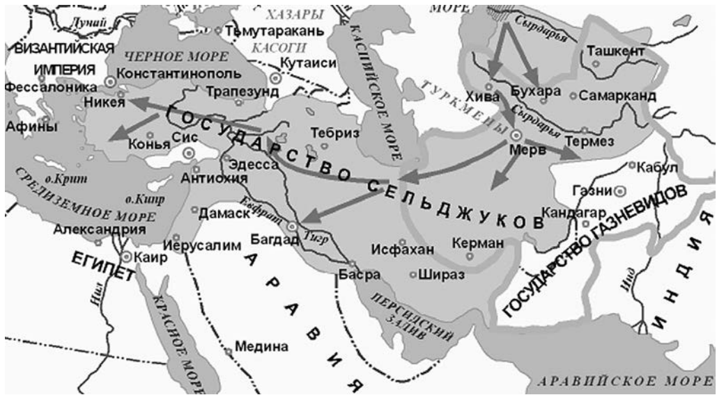
Рис. 1. Сельджукское государство в период наивысшего расцвета

Тогрул под легитимным предлогом борьбы с Буидами (своеобразной конфедерацией персидских правителей, захвативших большинство светских постов в Халифате) и восстановления полноты власти халифа занял Багдад и стал не только зятем халифа, но и султаном — светским правителем мусульманского государства. Выгадали от этого обе стороны — после фактического отстранения при Буидах халиф вернул себе по крайней мере внешние атрибуты власти, а султан, искренне поддерживая его духовный авторитет, стал главой разветвленной династии Великих Сельджуков, осуществляя светскую власть в Халифате, раздавая посты своим родичам и соплеменникам и направляя активность (прежде всего военную) тюркских переселенцев на Запад, к анатолийским владениям Византии.