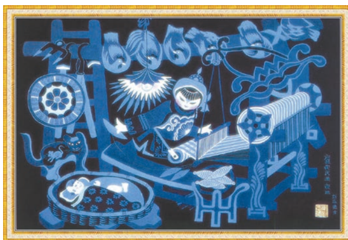
Рис. 4. Лю Чжидэ. Ночная мелодия (Ецю, 夜曲)