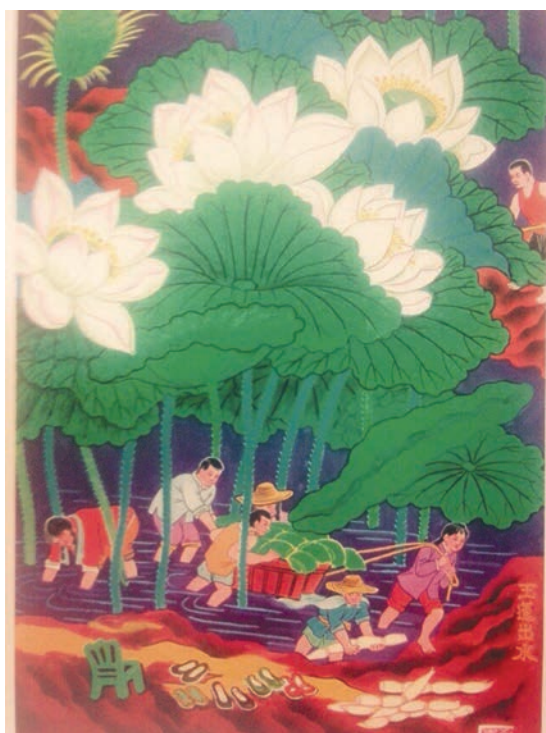
Рис. 6. Лю Чжидэ. Урожайный год (Фэньнянь, 豐年)