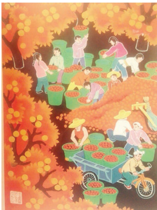
Рис. 5. Лю Чжидэ. Труд (Лаоцзо, 勞作)