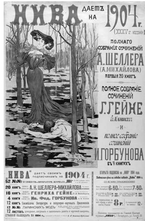
Рис. 2. Е. П. Самокиш-Судковская. Обложка журнала «Нива». 1904 г.