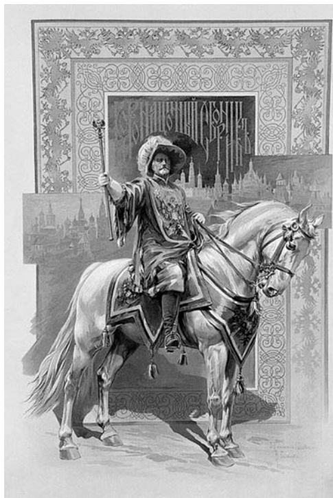
Рис. 1. Н. С. Самокиш. Герольд. Иллюстрация к альбому «Коронационный сборник 14 мая 1896 года». 1899 г.

В своих работах Н. С. Самокиш и Е. П. Самокиш-Судковская применяли разнообразные орнаментальные элементы: бордюры, гирлянды, ленты, цветы. В этих работах они добились конструктивной легкости и простоты рисунка. Красные буквицы, виньетки, заставки, концовки — все было изящно, оригинально и трактовано по-новому. Рисунки выполнены в самой разнообразной технике: пером и тушью, акварелью и позолотой. По уникальности оформления данное издание относится к высокохудожественным произведениям книжной продукции рубежа XIX–XX веков и является одним из роскошных книжных изданий Серебряного века.