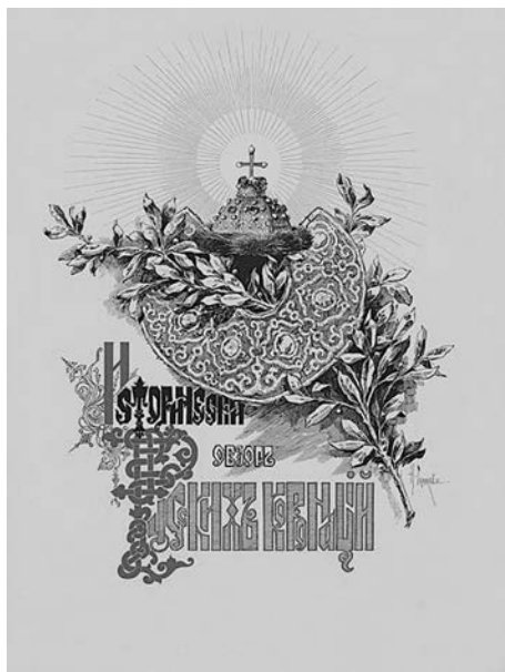
Рис. 4. Н. С. Самокиш. Заставка к альбому «Коронационный сборник 14 мая 1896 года». 1899 г.

Большой популярностью в начале XX века пользовалось издание «Конек-горбунок» Петра Ершова 19 [18]. Рисунки для иллюстрирования сказки были выполнены Е. П. Самокиш-Судковской, получившей после этой работы еще большую известность.