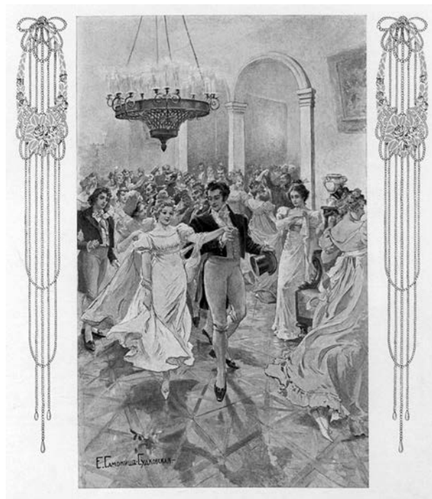
Рис. 6. Е. П. Самокиш-Судковская. На балу. Иллюстрация к изданию «Евгений Онегин» А. С. Пушкина. 1911 г.

бурге и Царском селе в разные периоды времени: «Станция Царскосельской ж. д. в С.-Петербурге. 1837», «Первый проезд Императора Николая I по Царскосельской ж. д. 1837», «Станция Царскосельской ж. д. в С.-Петербурге. 1900», «Станция Царскосельской ж. д. в Царском селе. 1902». В композицию всех четырех картин художник включил изображение лошадей, «разместив» этих замечательных животных на стене зала ожидания железнодорожного вокзала, словно напоминая, сколь тесно были связаны человек и лошадь, и что гужевой транспорт играл еще значительную роль.