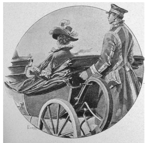
Рис. 3. Е. П. Самокиш-Судковская. Провинциальная дама едет с визитом. Иллюстрация к изданию «Похождения Чичикова, или Мертвые души» Н. В. Гоголя. 1900 г.