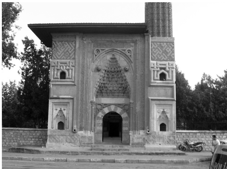
Рис. 7. Портал комплекса Сахип Ата в Конье

Мечеть обычно датируется 1258–1259 гг. и, согласно строительной надписи на портале, была построена по заказу Фахреддина Али мастером Кёлюком ибн Абдаллахом, который в 1271 г. строил и Гёк-медресе в Сивасе. Однако еще в 1265 г., возводя