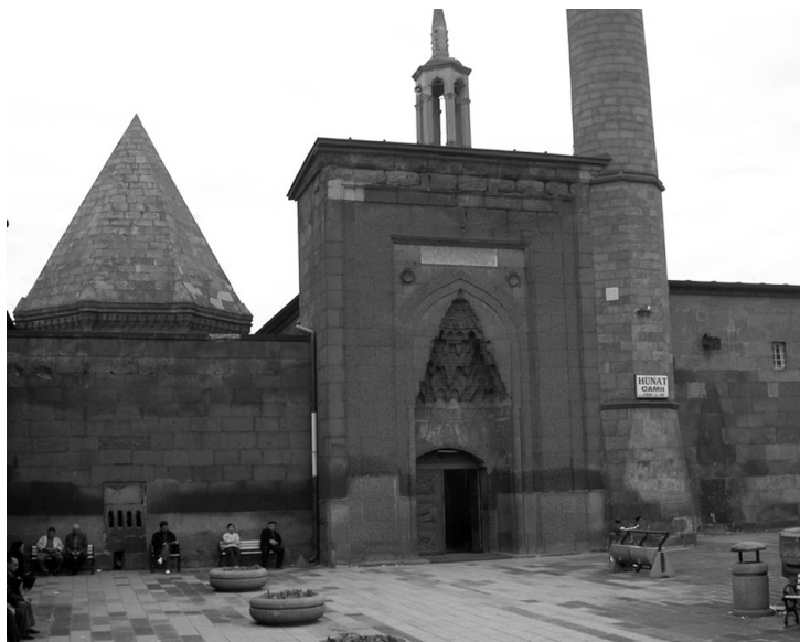
Рис. 2. Портал мечети Хатуние в Кайсери

султана Алаеддина Кейкубада, сына Кейхосрова...», а в строительной надписи больницы султан вообще не упоминается — возможно, благотворительное медицинское учреждение воспринималось вне государственной идеологии, и на его оформление не распространялись требования политической риторики [7, р. 183, 189–190].