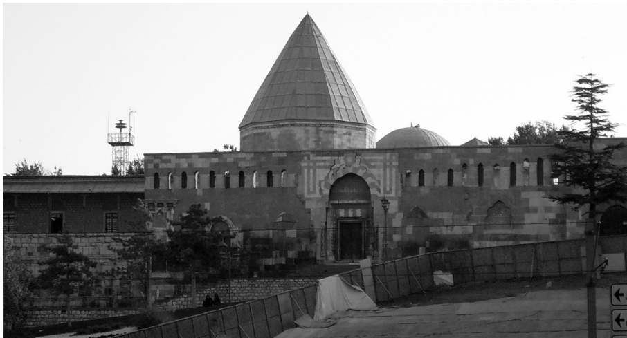
Рис. 6. Мечеть Алаеддина в Конье

Второй памятник, использование в котором «сельджукского портала» вызывает вопросы, — мечеть Сахип Ата, редчайший для Коньи пример композиции «минареты на плечах портала». В момент своего возникновения мечеть, располагавшаяся за южными городскими воротами, превосходила по размерам не только ранние заказы Фахреддина Али, но и все, что было построено в Конье по частному заказу; однако в XIX веке оригинальное здание сгорело, и нынешняя мечеть Сахип Ата является результатом далеко не бесспорной реконструкции (рис. 7).