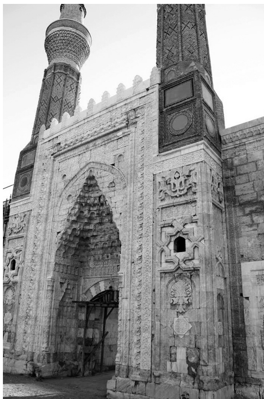
Рис. 4. Портал Гёк-медресе в Сивасе

отождествляемой с династией Сельджуков Рума. В этом качестве он появляется на фасадах караван-сарая, мечетей и медресе, воздвигаемых от имени сельджукских султанов, но, как показывает пример комплекса в Дивриги, не используется в постройках на подчиненных землях без указания формулы вассалитета. Вдова и дочь Алаеддина Кейкубада еще правомерно использовали «сельджукский портал» в качестве эмблемы могущества династии, к которой принадлежали, но сын Алаеддина, чьи войска были разгромлены монголами, уже не считал возможным оперировать этим маркером.