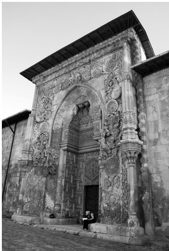
Рис. 1. Портал мечети в Дивриги

Значение имели, вероятно, и выбор воспроизведенных на порталах коранических аятов, шрифтов, которыми они были начертаны, форма и обрамление каллиграфических панно [6, с. 25–27]. Таким образом, порталы оказывались носителями кодированной информации и частью особой информационной системы.