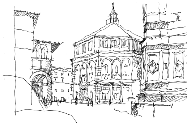
Рис. 3. Баптистерий Сан Джованни — самое старое сооружение на Пьяцца дель Дуомо; о нем вспоминал в своем изгнании Данте.

мастерски использовал опыт своих предшественников. Архитектурно-художественное решение Баптистерия претерпело в XIV и XV вв. существенные изменения, значительно повысившие его выразительность. В 1330–1336 гг. появились южные ворота, творцом которых был Андреа Пизано, а в 1403–1424 и 1425–1452 гг. — северные ворота и открытые к собору главные, восточные Райские ворота, созданные Лоренцо Гиберти.