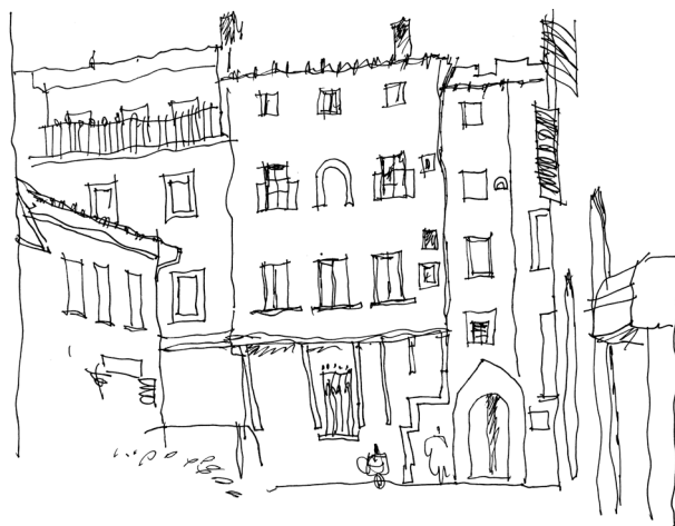
Рис. 4. Фасады городских домов, с их многочисленными надстройками и перестройками, часто рассказывают о своей сложной многовековой судьбе.

цо, подражающие им постройки в духе историзма, обывательские дома со следами многочисленных надстроек и реконструкций (рис.4). На этом живописном фоне выделяются притягивающие к себе внимание своеобразные «магниты» памятников зодчества, знакомые ранее только по путеводителям и учебникам. На пути к палаццо Веккио наше внимание привлекает угловая Лоджия дель Бигалло, а затем мы останавливаемся у Орсанмикеле, потом у Старого рынка с его бронзовой скульптурой кабана... Отвлекаясь по пути лишь на недолгие зарисовки, добираемся до площади Синьории.