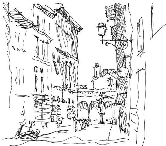
Рис. 1. Узкая прямая улица Да Серви ведет от площади Аннунциата к Дуомо.

Сосредоточены эти сокровища в основном на северном берегу Арно в пределах транспортного полукольца, проложенного на месте бывших крепостных стен. От них сохранились лишь укрепления Фортецца да Бассо и отдельные сторожевые башни на узловых площадях города. Территория эта относительно невелика, и сегодня здесь существуют транспортные ограничения; некоторые из них вызваны особенностями застройки (улицы такие узкие, что на некоторых трудно разойтись даже пешеходам), другие — стремлением обеспечить больше удобства потокам пешеходных туристских групп. Но главным было желание оградить исторические ценности от нежелательного воздействия транспортных потоков — вибраций, воздействия выхлопных газов и т. д.