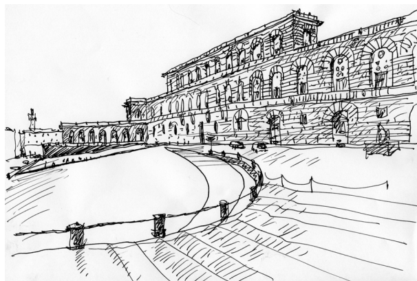
Рис. 7. Размещение Палаццо Питти удачно использует особенности рельефа. Перед его главным фасадом оказалась часть склона холма Боболи, что придает сооружению дополнительную представительность и повышает оборонительный ресурс.