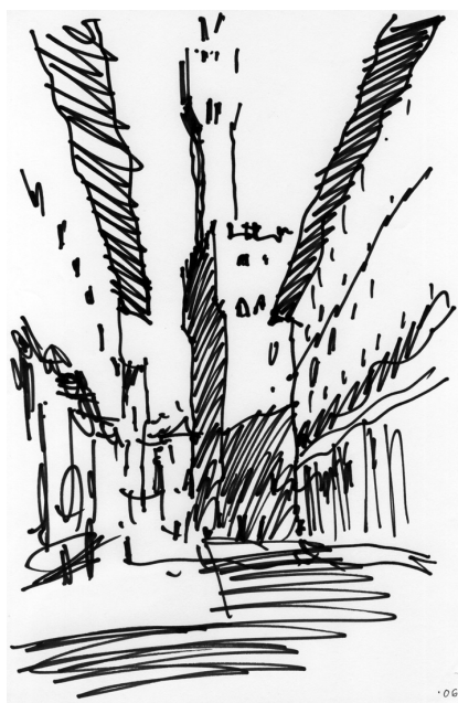
Рис. 5. В просвете улицы Уфици вырисовывается башня Палаццо Веккио — самая высокая во Флоренции.

Бюрократии эпохи Возрождения, как и современной, была свойственна склонность к постоянному расширению и приумножению. Для нужд все увеличивающейся армии чиновников к Палаццо Веккио со стороны южного фасада был пристроен новый корпус. Также возведен комплекс, протянувшийся от площади Синьории к берегу реки Арно и известный как Уфици (слово ufficiale в итальянском языке означает чиновник, должностное лицо. Отсюда произошло слово офис ) и предназначенный для так называемого Третьего магистрата. Строительство осуществлялось в 1560–1580 гг. под руководством Вазари, а после его смерти (1574) — Бернардо Буонталенти и впоследствии Альфонсо Париджи. Два параллельных корпуса с практически симметричными фасадами образуют прямую меридионально ориентированную улицу, эффектно раскрывающуюся и в южном направлении, к реке Арно, и в северном, с видом на башню Синьории (рис.5).