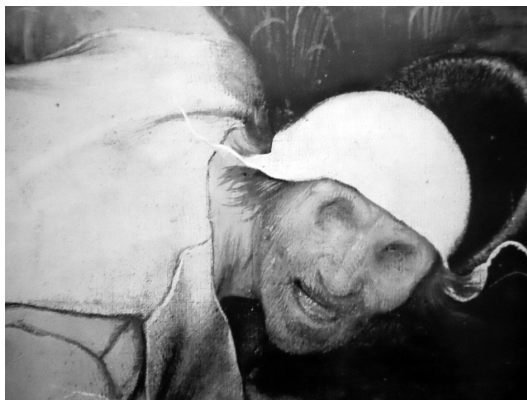
Рис. 3. П. Брейгель. Притча о слепых. Фрагмент