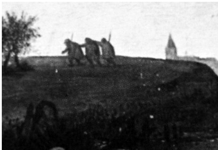
Рис. 4. П. Брейгель. Нидерландские пословицы. Фрагмент

или ленью ума, высокомерным отношением к людям, лишившимся физической полноценности.