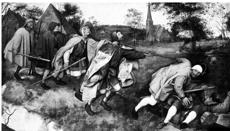
Рис. 1. П. Брейгель. Притча о слепых

Посмотрим на картину (рис. 1). Шесть слепых вереницей бредут мимо деревни или по окраине небольшого селения. Направление их движения — нисходящая (падающая) линия, опускающаяся слева направо к ручью или пруду. Их слепой поводырь упал в неглубокую воду. В нелепой позе с беспомощно раскинувшимися в стороны руками и ногами он напоминает упавшее на спину насекомое. Его лицо — комок плоти. Ведомые им слепые тоже обречены упасть один за другим. Ситуация непоправима и трагична.