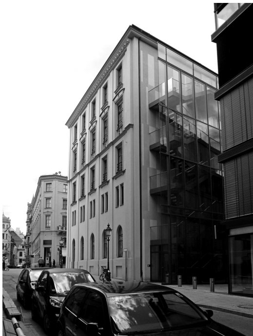
Рис. 7 (фото). Вид на модернизированное здание Брюкляйнхауза на Максимилианштрассе со стороны бокового проезда. Задний фасад представляет собой сплошную плоскость стекла, в то время как оба торцевых и главный фасады сохраняют неизменным исторический облик.

вартальной территории новыми корпусами вспомогательной сцены Национального театра и решенными в стиле хай-тек (рис. 7).