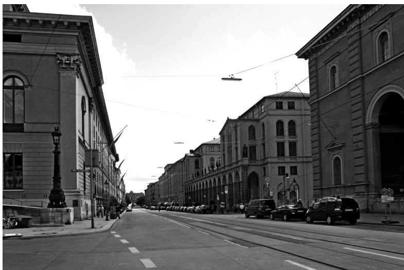
Рис. 6 (фото). Максимилианштрассе — одна из четырех наиболее важных радиальных улиц в центре Мюнхена, которая связывает площадь у Национального театра со зданием Максимилианеума. Ее застройка была произведена в середине XIX века по инициативе короля Максимилиана II, который считал, что образ возводимых здесь зданий должен отражать «баварский национальный дух»

и замыкается на другом берегу реки Изар представительным зданием Максимилианеума (рис. 6). В свое время его построили для размещения учебных заведений, призванных готовить юношество к государственной службе (арх. Ф. Брюклейн, 1857–1874 гг.), но впоследствии здание многократно меняло свои функции. Как и другие строения на Максимилианштрассе, это строение решено в духе историзма, с элементами ренессанса и неогрека. В военные годы оно было на две трети разрушено бомбардировками и восстановлено уже к 1949 г. с сохранением существовавшего ранее облика (К. Кергль). Для удовлетворения все возрастающей потребности в служебных площадях было произведено существенное расширение (в два приема — в 1992–1994 и 2010–2012 гг.). Принципиально важно, что новые корпуса появились с восточной стороны исторического здания и имеют сравнительно небольшую высоту, так что они совершенно не просматриваются ни со стороны центра, ни на подходе к зданию.