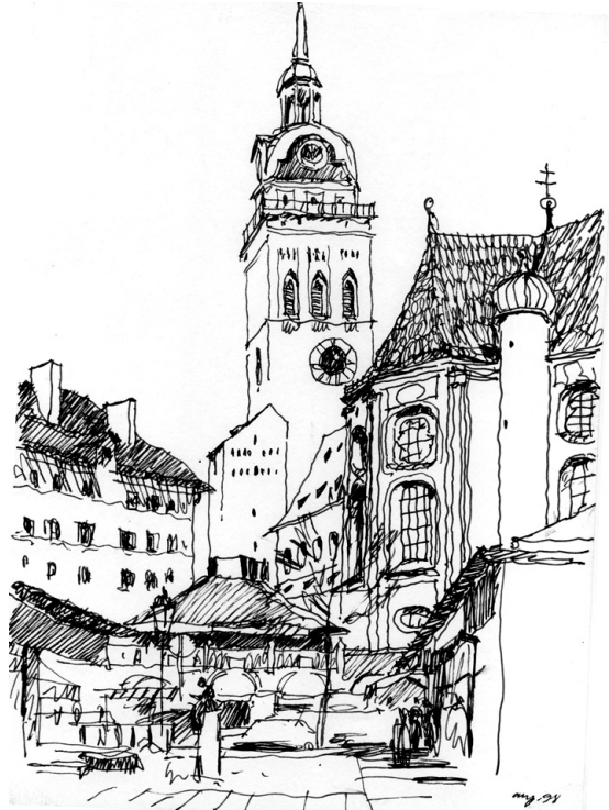
Рис. 10. Насыщенная городская среда в районе рынка Виктуалиенмаркт. На переднем плане торговые киоски, за ними видна церковь Св. Петра. Ее внешний облик сложился в результате многочисленных пристроек и перестроек в период с 1368 г. по 1756 г.