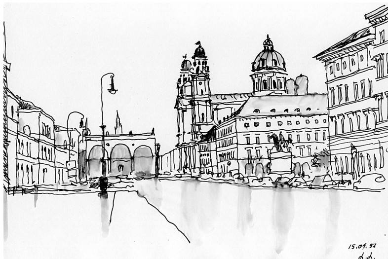
Рис. 13. Одеонс-платц. Отсюда начинается Людвигштрассе, одна из четырех важнейших радиальных улиц и самая «итальянская» улица в Мюнхене. Ее застройка в духе классицизма («неоклассики», как говорят в Германии) сложилась в первой половине XIX века. На рисунке справа на заднем плане Театинеркирхе, слева — лоджия Фельдхеррнхалле, построенная в 1841–44 гг. в честь баварской пехоты по образцу флорентийской Лоджии деи Ланци. В 1852 г. как другой ключевой элемент ансамбля на расстоянии в 1 км по оси Людвигштрассе была построена Арка победы. В 2004 г. на заднем плане за нею стал читаться голубой силуэт самого высокого здания в Мюнхене.

Впрочем, и в этом направлении не все складывалось гладко. Как и во многих других городах, проблемы вызвало строительство высотных зданий. Самым высоким сооружением города, как и раньше, остается телевизионная башня в Олимпийском комплексе высотой в 291 метр с видовой платформой на отметке в 192 метра, построенная еще в 1968 г. Однако в начале 2000-х гг. один за другим на периферии города стали подниматься высотные корпуса. Небоскреб Uptown Muenchen высотой в 146 метров вызвал недовольство тем, что изменил видовые перспективы из исторического комплекса Нимфенбург. Затем в 2004 г. по проекту архитектора Х. Яан