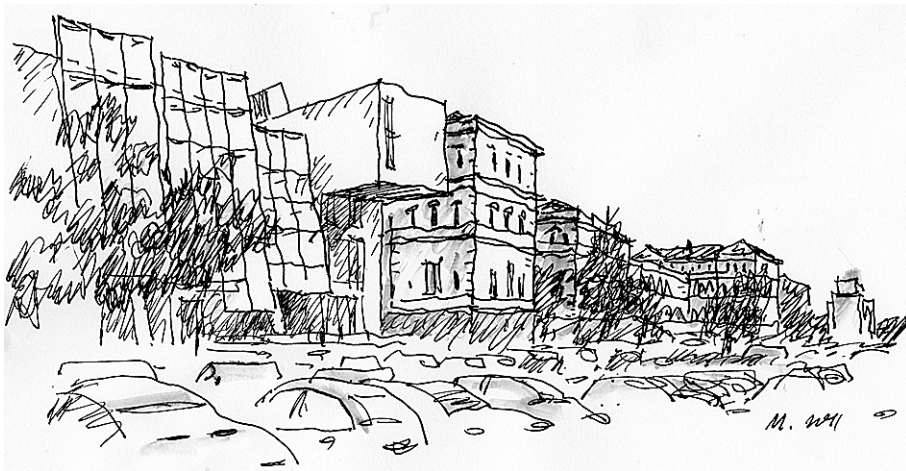
Рис. 12. Академия художеств находится в центральной части города, вблизи Леопольдштрассе, по соседству с Университетом. Она получила широкую известность перед Первой мировой войной. Здесь учились Василий Кандинский, П. Клее, А. Муха и другие известные художники. Здание Академии, возведенное в 1874–85 гг. в формах историзма, сильно пострадало во время войны. При восстановлении воссоздали пластику фасадов, но вынуждены были отказаться от пластичных форм покрытия над главным и боковыми корпусами. На переднем плане рисунка изображен новый корпус, построенный в 2005–2006 гг. по проекту архитекторов группы Соор Himmelb(l)au.

И в новом строительстве в центральной части города господствует сдержанность, умение отойти на задний план вблизи памятников зодчества. Надо отметить, что масштабы нового строительства крайне невелики. Никто не покушается на остающиеся зеленой зоной площадки вдоль реки Изар или за задним фасадом Новой ратуши. Используются лишь участки зданий, разрушенных в годы войны. Значительная часть новых объектов отвечает на потребности культуры и высшего образования. Возникающие сооружения невелики по высоте — лучшим считается вариант новостройки, отметка карниза которой совпадает с соседями. Даже склонные к эскападе проектировщики бюро “Соор Himmelb(l)au” в своем проекте нового корпуса Академии искусств не смогли преодолеть подобную установку, подогнали его габариты к показателям неоренессансной постройки Главного корпуса (1876–1885 гг.) и дали себе волю только при оформлении фасадов и интерьеров пластикой из гигантских металлических конструкций (рис. 12). Впрочем, архитектурный образ других новостроек в историческом центре характеризуется сдержанностью форм, а в некоторых случаях (Высшая школа телевидения и кино — арх. Бём, 2011 г., Музей Бранхорст — арх. Зауэрбрух Хуттон, 2009 г.) тяготеет к минимализму. Попыток заниматься стилизацией в духе историзма не просматривается.