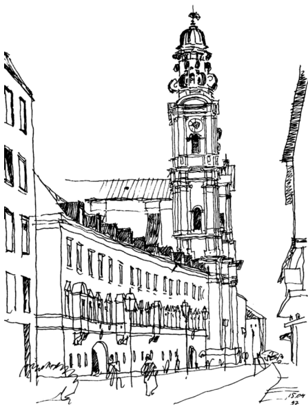
Рис. 1. Вид вдоль улицы Театинерштрассе в центре Мюнхена. Улицу назвали так из-за находившегося здесь монастыря ордена театинцев (бывшие монастырские корпуса видны в левой части рисунка). Этот орден дал имя и возведенной здесь церкви в честь Св. Каэтано. На первом этапе строительства Театинеркирхе (1663–1667 гг.) работы осуществлялись по указаниям болонского зодчего А. Борелли. Решающим стал второй этап (1668–1690 гг.), когда по проекту Э. Цукалли соорудили купол и колокольные башни. Оформление фасадов было исполнено намного позже. Церковь Св. Каэтано (Театинер-кирхе) считают первым произведением позднего барокко севернее Альп.

Очень сильно изменился облик города в период Второй мировой войны. Бомбардировками были уничтожены половина построек, а в центре — почти 90%. Про-