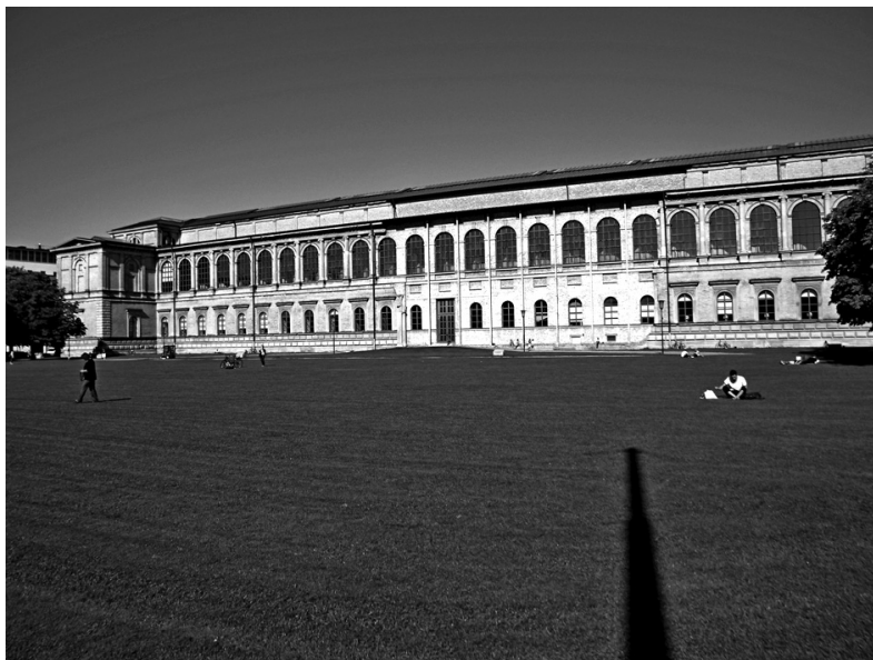
Рис. 5 (фото). Существующее сегодня здание Старой Пинакотeki известно не только как произведение Лео фон Кленце (1826–1836 гг.), но и как итог заботливой реставрации, произведенной Х. Дёлльгастом в 1946–1957 гг. Огромный зеленый луг сохранен в центре Мюнхена на месте разрушенных казарм. Он протянулся между зданиями Старой Пинакотeki, Пинакотeki современного искусства (С. Браунфельс, 2002 г.), Высшей школы телевидения и кино — (арх. Бём, 2011 г.), Музея Бранхорст (арх. Зауэрбрух Хуттон, 2009 г.).

зовали существовавший рисунок переплетов. Венчающий карниз на разрушенном участке выполнен с сохранением его габаритов, но без какой-либо отделки. Отделка лишена и вся плоскость восстановленных фасадов. Лишь вертикальные трубы небольшого диаметра, установленные по осям простенков, поддерживают единый ритм полуколонн, заданный Лео фон Кленце (рис. 5). В настоящее время мы можем не только представить себе первоначальный облик Старой Пинакотeki, но и масштабы разрушений, и условия реставрации.