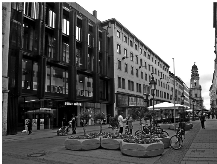
Рис. 9 (фото). Один из входов в торгово-деловой комплекс «Фюнф хофе» («Пять дворов»). Он играет роль локального акцента на фасадном фронте Театинерштрассе.

стороны улиц вы не заметите никаких перемен — все привлекающие публику аттрактивные пространства остались за плоскостью сохранивших свой облик стен. Единственным знаком нового стал новый небольшой фасад с модными металлическими перфорированными створками со стороны Терезинштрассе, который приобрел лишь локальное значение (рис. 9).