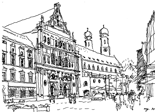
Рис. 3. Пешеходная улица Нейхаузер-штрассе. Слева видна церковь Св. Михаила (1581) — важнейший памятник ренессанса севернее Альп, известная также своим цилиндрическим сводом, который имеет пролет в 20 метров. В 1944 г. сильно пострадала. В 1946–1948 гг. восстановлена, но работы по оформлению фасадов и скульптурных элементов продолжались до 2013 г. За нею — бывшая церковь августинцев, которую начали строить в 1291 г., а в 1618–1621 гг. придали черты барокко. С 1966 г. здесь разместился Немецкий музей охоты и рыболовства.

Через узкие поперечные улочки просматриваются луковичные купола башен Мариенкирхе, признанной символом города. Акцентные сооружения дополняются реставрированными постройками начала XX века в духе историзма, фонтанами и скульптурой, в том числе привлекающим туристов бронзовым изображением кабана — копией флорентийского (напомним: «Мюнхен — самый северный итальянский город»). Наконец, мы выходим на Мариенплатц, где можем увидеть комплекс Старой Ратуши, включивший в себя оборонительную башню бывшей крепостной стены и фонтан Мариензойле, который символизирует избавление Мюнхена от бедствий 30-летней войны. Доминирует на площади огромная неоготическая Новая