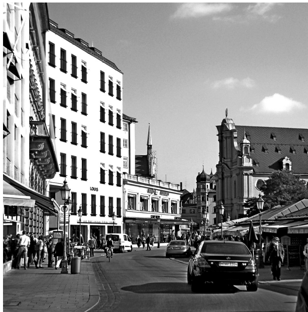
Рис. 11 (фото). Окружение отеля “Louis” насыщено выразительными памятниками архитектуры, поэтому авторы проекта проявили чувство такта, умение сохранить фоновый характер создаваемого объекта. Эта работа отмечена в 2012 году премией города Мюнхена «За сохранение образа исторического города».