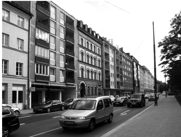
Рис. 2 (фото). Облик Тюркенштрассе в центральном районе Максфорштадт характерен для многих улиц, пострадавших во время войны. Высота зданий, восстановленных в послевоенные годы, принималась в соответствии с историческими документами, а отделка фасадов выполнялась предельно экономичной. На фоне новостроек выделяются отдельные сохранившиеся здания.

Чтобы обеспечить крышу над головой горожанам и прибывавшим в Мюнхен беженцам, здесь планомерно воссоздавались стоявшие вдоль красной линии здания. Исходя из реальной ситуации на каждом участке, либо ремонтировались сохранившиеся стены, либо возводились новые, но в довоенных габаритах. В этом случае чаще всего происходило уплотнение внутреннего объема и вместо 4 прежних этажей в доме домовладелец получал 5–6 (конечно, при этом соответственно снижалась высота потолка в квартирах). Выполнить дорогостоящую отделку фасадов было тогда не по карману ни городу Мюнхену, ни владельцам разрушенных или поврежденных домов. Чаще всего обходились временными упрощенными решениями. В последующие годы происходило обновление некоторых из построек того времени в соответствии со вкусами и потребностями наших дней: стало больше стекла, кое-где возведены небольшие надстройки. Важно, что при этом ландшафт центра, как и прежде, характерен горизонтальным силуэтом с редкими доминантами церковных куполов,