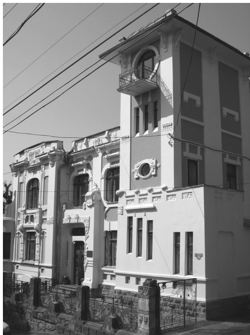
Рис. 4. Винница. Особняк А. Чоткова на ул. Пушкина, 38 (арх. Г. Артынов, 1910 г.). Фото из личного архива Ю. Ивашко (2006 г.)