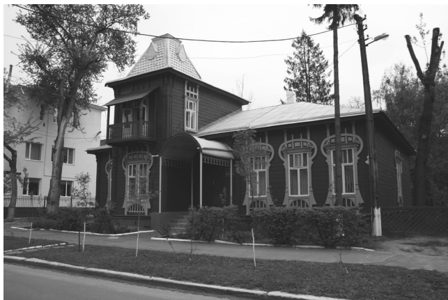
Рис. 6. Чернигов. Усадебный дом на ул. Коцюбинского, 39 (нач. XX в.).

В границах массива модерна отмечаются зоны модерна с максимальной концентрацией объектов: это территории Львов — Станиславов — Черновцы и Сумы — Харьков — Полтава — Екатеринослав.