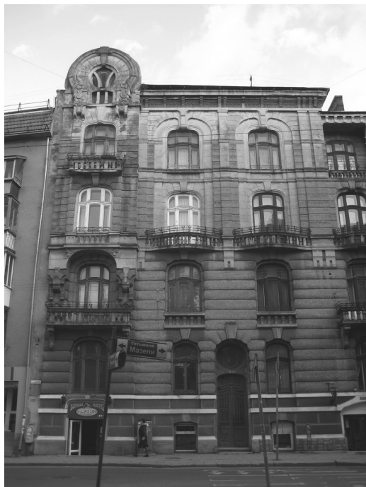
Рис. 3. Ивано-Франковск. Доходный дом на ул. Гетьмана Мазепы, 83 (нач. XX в.). Фото из личного архива Ю. Ивашко (2006 г.)

архитектуры модерна Львова, Станиславова, Стрия (где работали львовские, польские, австрийские архитекторы) (рис. 3), Киева и Черкасс (благодаря «авторскому» модерну архитектора В.Городецкого), Харькова и Екатеринослава (благодаря «авторскому» модерну А.Гинзбурга, А.Бекетова, А.Ржепишевского).