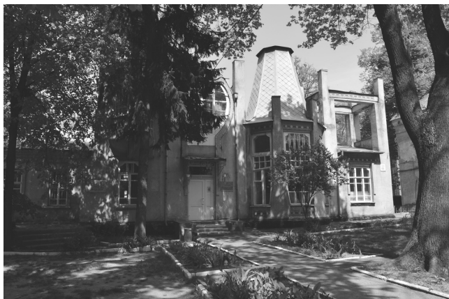
Рис. 5. Винница. Особняк Л. Длуголенского на ул. Первого мая, 66 (арх. Г. Артынов, нач. XX в.). Фото из личного архива Ю. Ивашко (2006 г.)