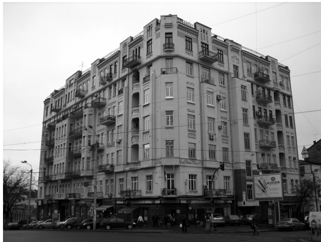
Рис. 1. Киев. Доходный дом Б. Мороза на ул. Владимирской, 61/11 (арх. И. Зекцер, 1910–1912 гг.).

Повышенный интерес к исследованию архитектуры модерна и к изучению специфики стилеобразования модерна в архитектуре обусловлен потребностью сохранения, реставрации, воссоздания и нового приспособления в соответствии с памятникоохранным законодательством объектов модерна Украины, особенно с учётом появления и распространения в современной архитектуре «неомодерна», который требует объективной оценки этого явления путём сравнения его эстетической системы с модерном конца XIX — начала XX столетия и более осознанного