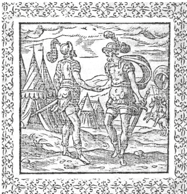
Рис. 5. Автор неизвестен. Виньетка к эмблеме Concordia в «Книге эмблем» Андреа Альчато. Антверпен: Издательство Христофора Плантена, 1577