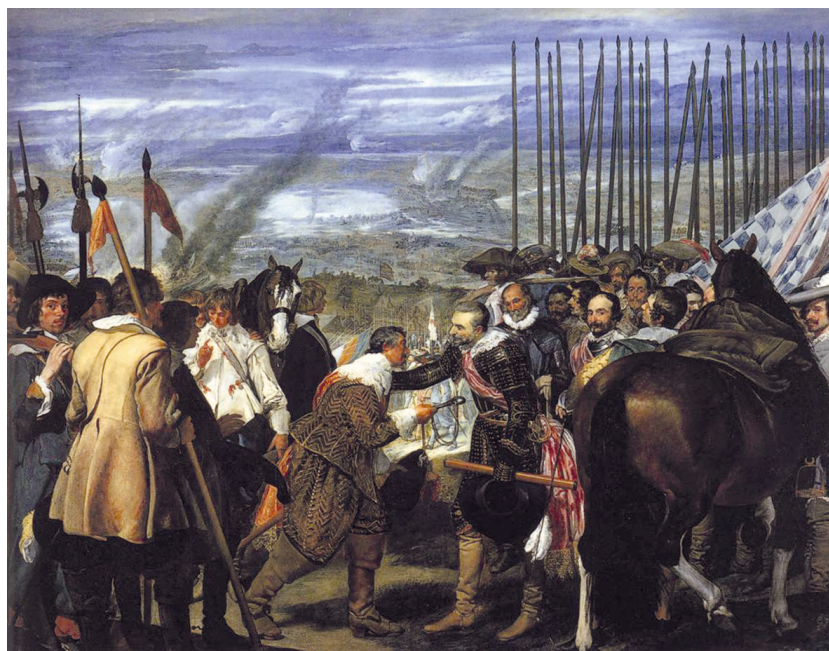
Рис. 2. Диего Веласкес. Сдача Бреды. 1634–1635. Холст, масло. 307 × 367 см. Мадрид, Прадо