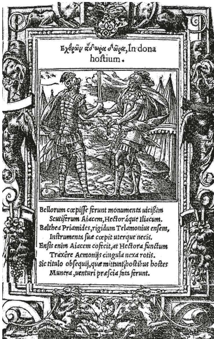
Рис. 10. Пьер Эскрик. Виньетка к эмблеме In dona hostium в «Книге эмблем» Андреа Альчато. Лион: Издательство Гийома Руйэ, 1550

эмблемы также изображены два воина на фоне военного лагеря — Аякс и Гектор (рис. 10). В основе эпиграммы Альчато лежит известный фрагмент из «Илиады»: после поединка греческий и троянский герои, заключив по воле богов перемирие, решили обменяться дарами — Гектор подарил Аяксу свой меч, Теламонид отдал сыну Приама свою портупею. Оба предмета сыграли фатальную роль в судьбе каждого из героев: Аякс покончил с собой, упав на меч Гектора, мертвое тело последнего было привязано портупеей Аякса к колеснице Ахилла. Таким образом, отмечает Альчато, дары врагов являются плохим предзнаменованием.