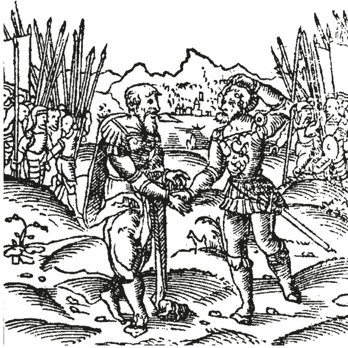
Рис. 3. Жан Меркур Жолля (?). Виньетка к эмблеме Concordia в «Книге эмблем» Андреа Альчато. Париж: Издательство Кретьена Вешеля, 1534

Современный комментатор пишет, что заслуга Альчато заключается в том, что он указал на глубокий смысл «одного из святых символов античного Рима» [2, р. 170]. У древних авторов неоднократно упоминается, что рукопожатие является символом проявления преданности, верности, любви и мира 5 . В эпиграмме Альчато рукопожатие выступает как знак военного союза. Вероятно, не последнюю роль в этом сыграли римские монеты, которые также стали одним из важнейших источников для итальянского юриста. Мино Габриэли приводит в своей книге прописки реверсов нескольких монет, соответствующих виньетке рассматриваемой эмблемы Альчато. Это могли быть монеты императора Галерия, относящиеся к 305–311 гг., и монеты императора Аврелиана, отчеканенные в период 270–275 гг. 6 Монеты с надписями « Concordia exercitum » (Армейское согласие) или « Concordia militum » (Военное согласие) обычно чеканились в сложные периоды римской истории, начиная с гражданских неурядиц 68–69 гг. н. э. На их реверсе обычно изображались два воина, обменивающиеся рукопожатием. Также существуют монеты, на реверсах которых, помимо центральных, пожимающих друг другу руки военачальников, присутствуют и их сподвижники: сестерций (209–211) Геты, аурей (186) Коммода. Подобные варианты особенно близки графическим изображениям, со-