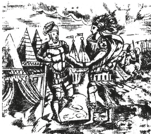
Рис. 6. Автор неизвестен. Виньетка к эмблеме Concordia в «Книге эмблем» Андреа Альчато. Нахера: Издательство Хуана Гастона, 1615