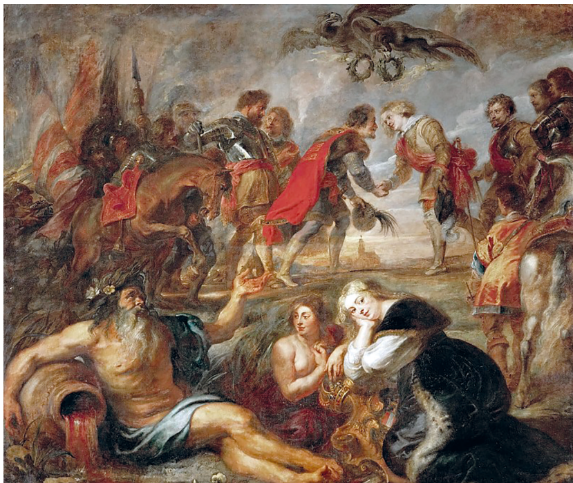
Рис. 1. Питер Пауль Рубенс. Встреча короля Венгрии Фердинанда с инфантом-кардиналом Фердинандом перед Нёрдлингенским сражением. 1634–1635. Холст, масло. 328 × 388 см. Вена, Музей истории искусств.