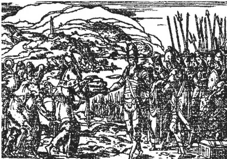
Рис. 8. Бернар Саломон. Встреча Авраама и Мельхиседека. Гравюра. Книга Клода Парадена «Quadrins historiques de la Bible». Лион, 1553