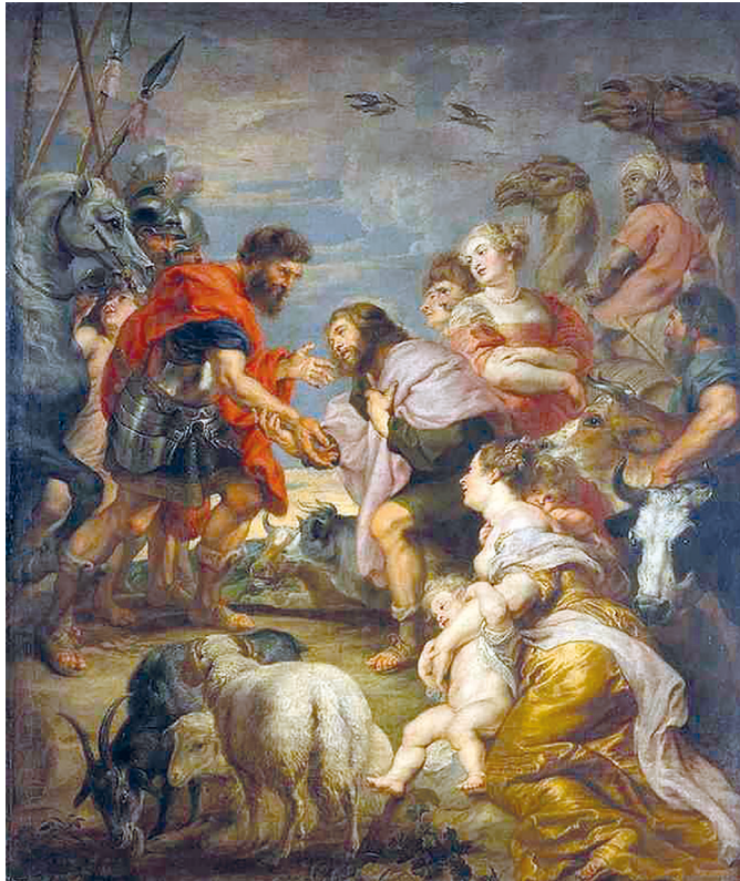
Рис. 7. Питер Пауль Рубенс. Примирение Иакова и Исава. Ок. 1625–1628. Холст, масло. 331 × 282 см. Обершлайсхайм, Государственная галерея замка Шлайсхайм