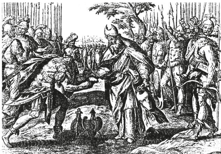
Рис. 9. Мартин де Вос. Встреча Авраама и Мельхиседека. 1579. Гравюра. Антверпен. Городской кабинет эстампов

привести хранящийся в Эрмитаже эскиз на тот же сюжет, приписываемый мастерской Рубенса и являющийся подготовительным наброском для одной из шпалер серии «Триумф евхаристии» (1620-е, Государственный Эрмитаж, Санкт-Петербург) [17, с. 31]. Правда, согласно теории М. Розеса, высказанной еще в конце XIX в., Рубенс при создании композиции с Авраамом и Мельхиседеком ориентировался на собственную картину «Встреча святого Амвросия с императором Феодосием» (1615–1616, Вена, Музей истории искусств) [18, р. 214]. Однако в последнем случае представленное событие носило диаметрально противоположный характер: