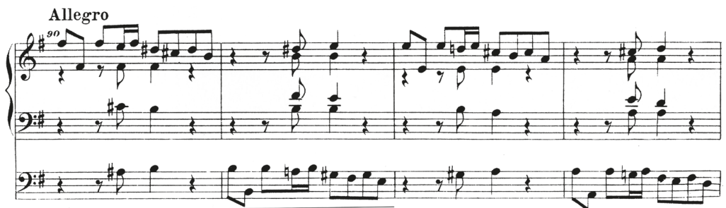
Рис. 3. Н. Брунс. Прелюдия e-moll (малая) [II]

двойной доминанты — вот приемы, которые в полной мере отражают игровое настроение фолькмаровского каприччио.