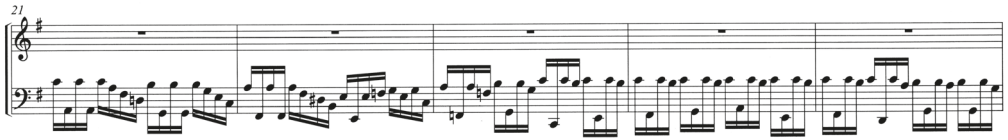
Рис. 4. Т. А. Фолькмар. Соната № 5, I часть [1]