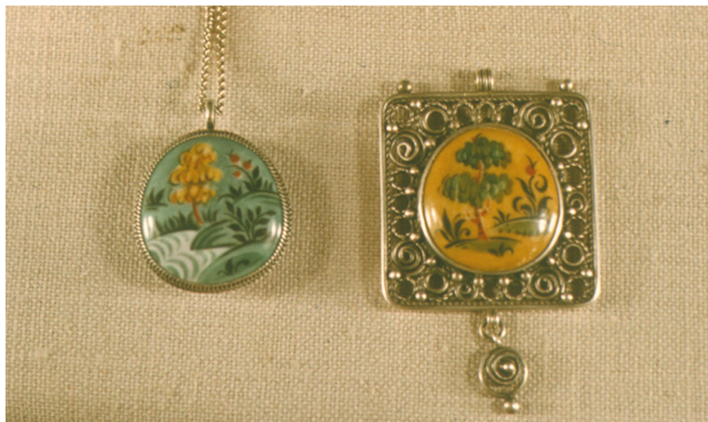
Рис. 2. Кулоны. Конец 1960-х. М. А. Тоне. Серебро, филигрань, роспись по эмали. Место хранения неизвестно.

Выпускница МИПИДИ, скульптор-керамист по образованию М. А. Тоне начала работу с изучения традиционного наследия промысла, включая первые после-