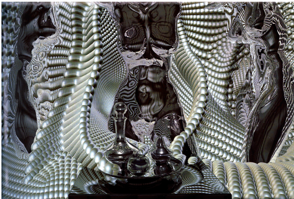
Рис. 7. Композиция «Жемчуга». 2017. К. В. Худяков. Сталь, эмаль. Собственность автора

в эмальерное искусство новой категории — «пространственной среды». Это то, что принесли в эмаль художники, которые предлагают решения, побуждающие к активному взаимодействию с пространством, с его метафизикой. Такие произведения настолько самодостаточны, что живут практически в любом пространстве, как в выставочном, так и в интерьере, в городе или парке.