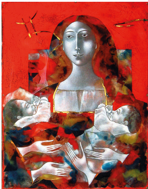
Рис. 4. Композиция «Близнецы». 2005. Н. М. Вдовкин. Медь, горячая эмаль. Собственность автора

ропольского художественного училища он организовал творческую поездку в г. Кечкемет. Свою мастерскую он превратил в творческую базу, где с 1991 г. стали работать семинары и проводились мастер-классы. Специальное оборудование, установленное в мастерской, позволяло использовать широкую палитру эмалей высокого и низкого обжига, что расширяло возможности разнообразить колористическое решение и в сочетании с фактурной проработкой эмальерной поверхности создавать сложные текстуры «живописного» слоя (рис. 4). Так сформировался экспериментальный творческий центр, где одновременно работали и опытные художники-эмальеры, и молодежь.