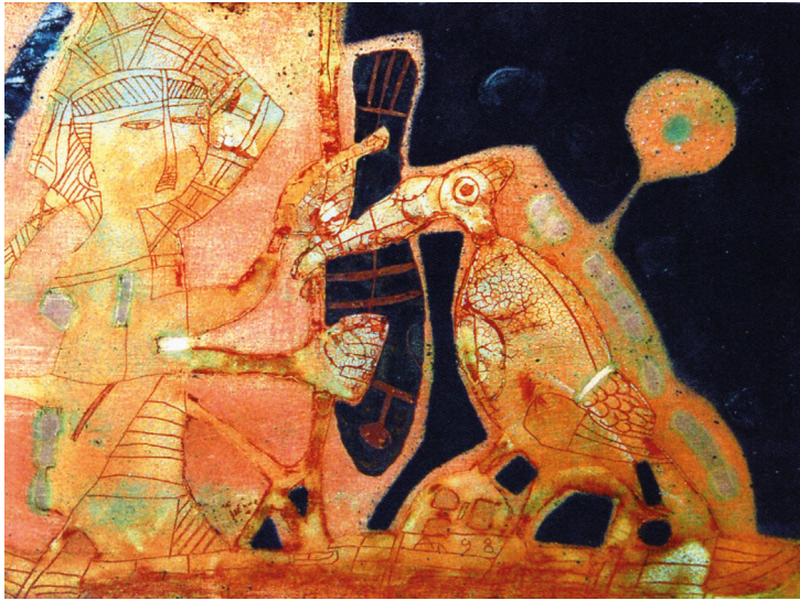
Рис. 5. Композиция «Птица-Рыболов». 1999. А. Ю. Талашук. Медь, горячая эмаль, золото. Собственность автора

искусства эмали, требует серьезных усилий и стратегического мышления. Для успешного развития проекта нужна долгосрочная выстроенная программа. Вторая Международная биеннале искусства эмали проходила под девизом «Солнце для всех» (2012) и открывала возможности представить свои работы художникам разных стран и художественно-стилистических направлений: от картины до предметной формы, от иконы до абстрактной композиции. Третья биеннале «Зеркало мира» (2017) приглашала участников к своего рода творческой рефлексии по поводу искусства эмали в контексте современных стилистических течений. Четвертая — «Золотая нить — дорога творчества» (2019) — акцентирует внимание не на результате, а на самом процессе творчества. Его многозначность не допускает прямолинейного решения задачи. Девиз последней биеннале ставил перед ее участниками сложную цель: не просто показать готовые произведения, но и ввести в дискуссионное поле сам творческий процесс.