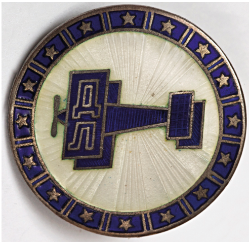
Рис. 1. Значок «Добролет». 1923. А. М. Родченко. Серебро, эмаль по гильоширу. Частное собрание

В коллекции представлен широкий ассортимент изделий: большие и малые значки круглой и овальной формы и в виде вырезанного по контуру биплана, запонки квадратной, овальной и круглой формы, зажимы для галстука, значки в петлицу. Особый интерес представляет соединение классических ювелирных решений и лаконизма аван-