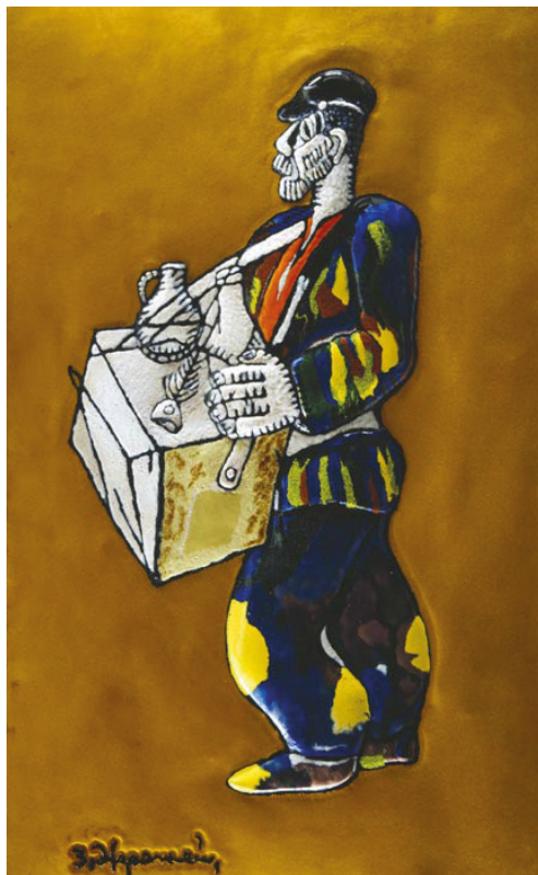
Рис. 6. Композиция «Уличная сценка». 2000-е. З. К. Церетели. Горячая эмаль. Галерея Зураба Церетели. Москва

ное произведение — монументально-декоративную скульптурную композицию «Букет» [19, с.8–9]. При всей неоднозначности авторской интерпретации жанра парковой декоративной пластики в мегаполисе решение объема в нарастании от «простого» (геометризованной формы основания) к «сложному» (подробно детализированной верхней части) считывается сразу. На эмоциональное восприятие этой декоративной пластики визуально влияет также меняющееся в зависимости от освещения ее колористическое решение.